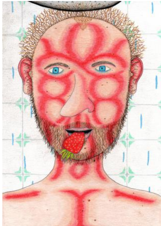
En dan de nieuwe ochtenden, 2023 pencil and paper, 14,8 x 21 cm