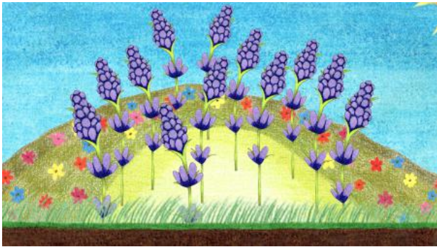
Towards tranquility, sanguinity, 2024 video (10:59), -