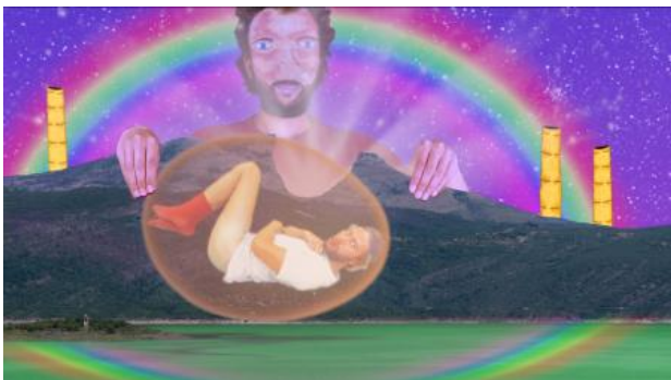
Beep (Piep) Beep (Piep) Buzz (Zoem) Beep (Piep) Buzz (Zoem), 2023 Video (20 min.), -