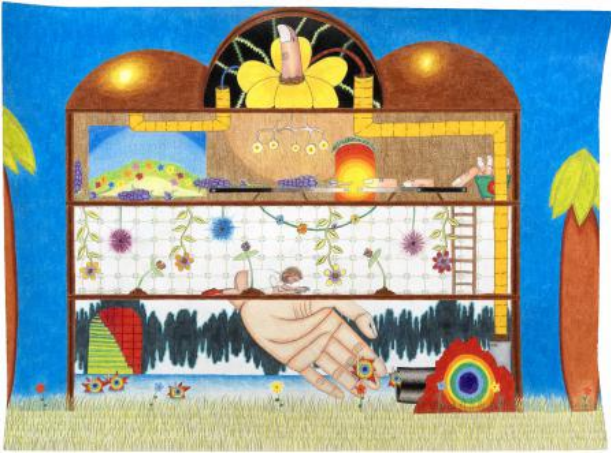
The house, 2024 pencil and paper, 29,6 x 40 cm