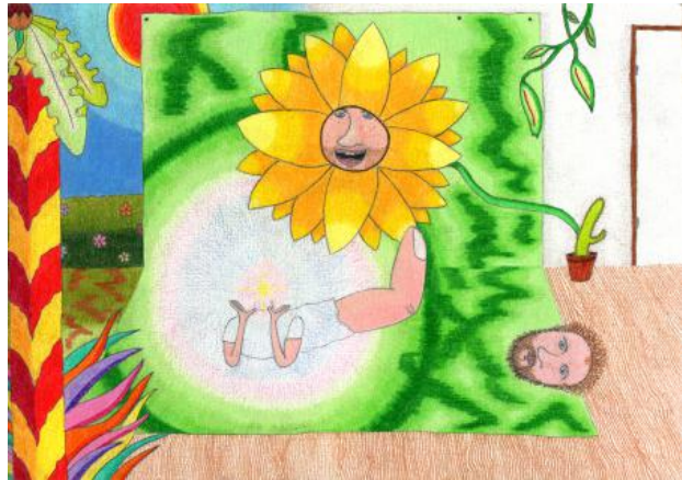
Untitled (studio view 3), 2023 pencil and paper, 21 x 14,8 cm