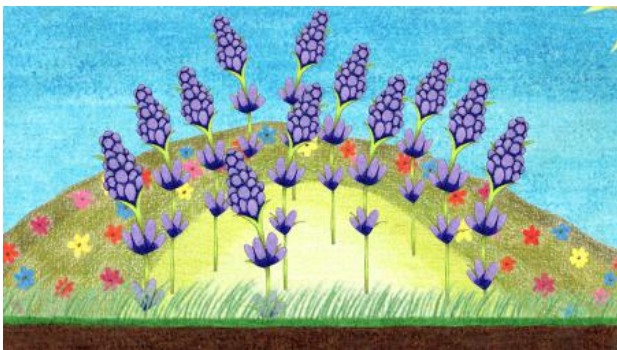
Towards tranquility, sanguinity, 2024 video (10:59), -