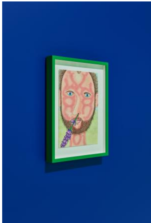
En dan de volgende ochtend, 2022 pencil and paper, 14,8 x 21 cm