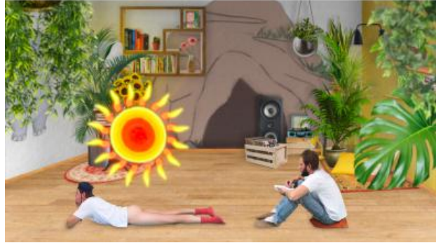
Beep (Piep) Beep (Piep) Buzz (Zoem) Beep (Piep) Buzz (Zoem), 2022 Video (20 min.)