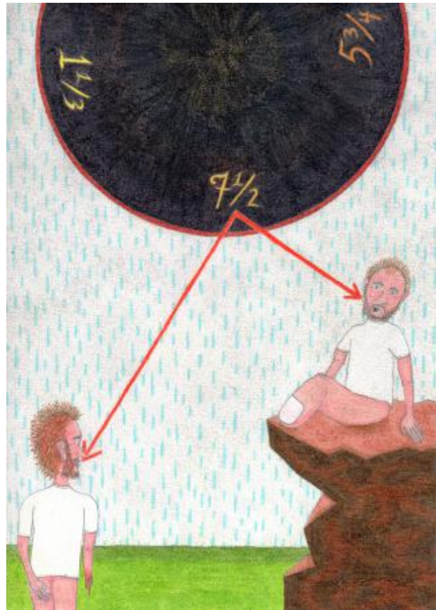
The fool, 2024 pencil and paper, 14,8 x 21 cm