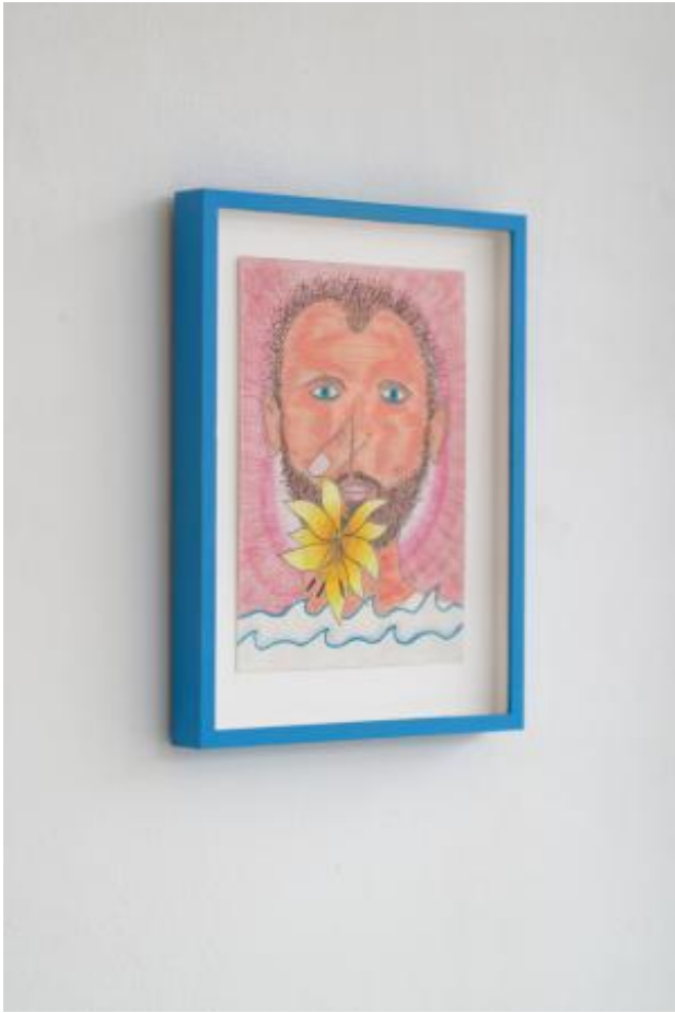
En op de drempel van balans, 2022 pencil and paper, 14,8 x 21 cm