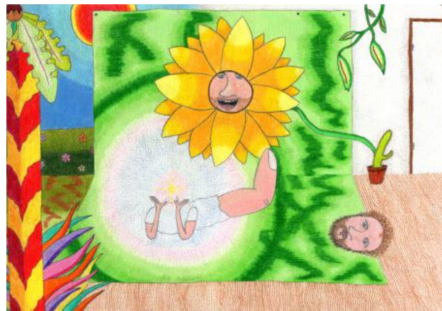
Untitled (studio view 3), 2023 pencil and paper, 21 x 14,8 cm