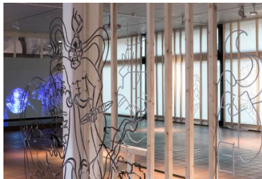
Upaya , 2020