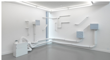
Trial and error, back and forth, 2017 Installation