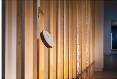
Upaya , 2021 Div techniques , 350 M2