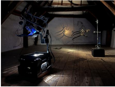
It comes in teams of two , 2022 Forged metal , -