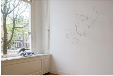
Heading into the forest, never to walk back again, 2022