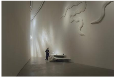
Cosmic current, 2023 installatie, L 30M x B 11M x H 2-4M