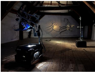
It comes in teams of two, 2022 Forged metal, -