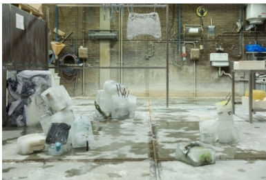
Beeldenstorm x Grafisch Atelier Daglicht, 2018 Timebased installation