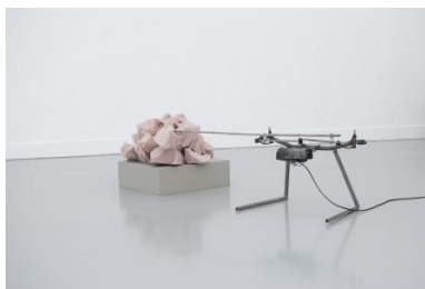
It's ok not to be complete , 2017