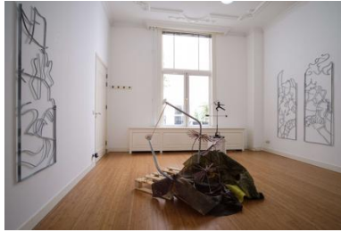
Heading into the forest, never to walk back again, 2022