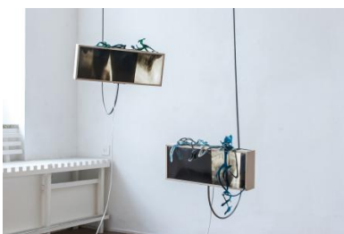
As a token of his never ending love, 2017 Video, soundscape, textile ceiling, light