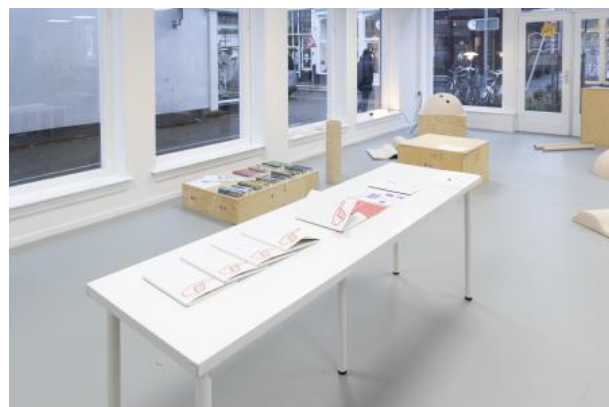
Pointing At Things Is The New Writing , 2025