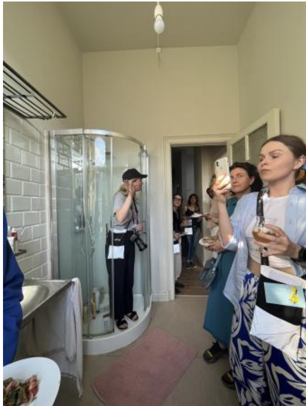
The Residency Tour, 2022 Performance, Stained Glass Window