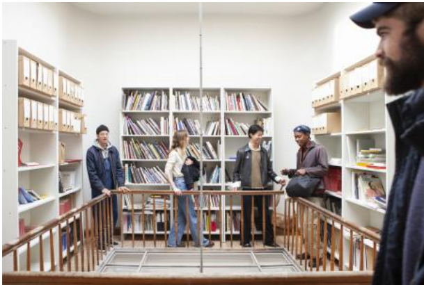
The Residency Tour, 2022 Performance, Stained Glass Window