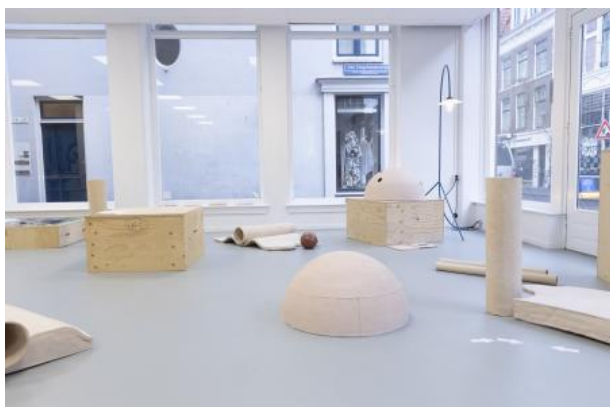
Pointing At Things Is The New Writing , 2025 Keramiek

2023 - Lecturer at KABK Loopt nog 2023 2023 - Co-directeur Platform BK 2025 2022 - Mentor at Stroom Invest Award 2023 2019 - Gast Docent 2019 2017 - -- Locatie Z/ Daisy Chain Loopt nog 2016 - PIP Expo 2020 2016 - Windmakers 2017