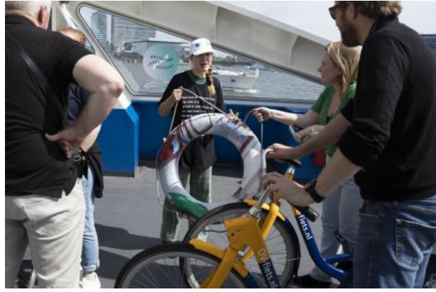
Verdwaal van hier naar daar vandaan dwaal af, 2022