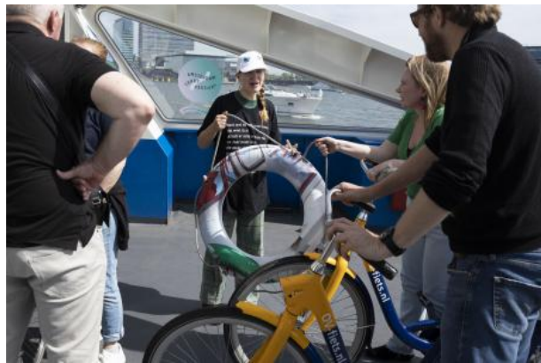
Verdwaal van hier naar daar vandaan dwaal af, 2022