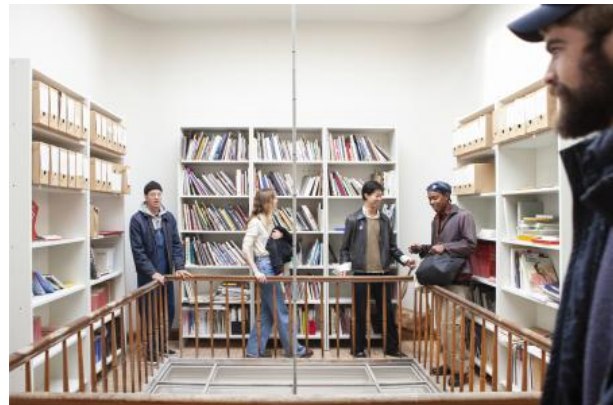
The Residency Tour, 2022 Performance, Stained Glass Window