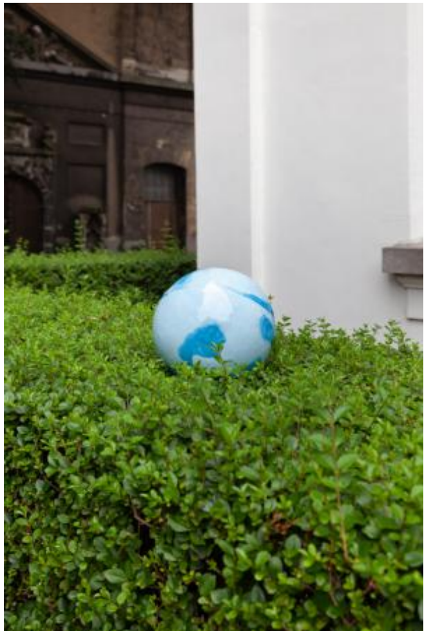
I found a shortcut through your hedge, 2021