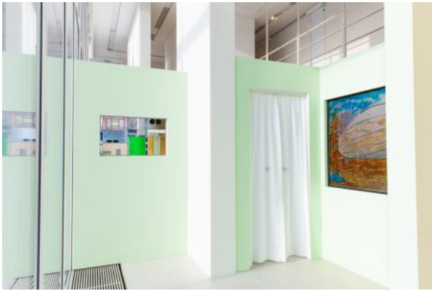
The Residency Plan, 2024 Glas in Lood