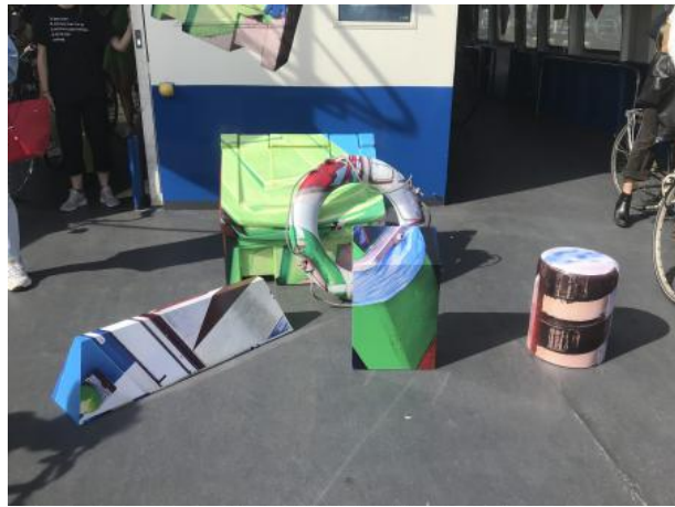
Verdwaal van hier naar daar vandaan dwaal af, 2022 Objects, Photoprint