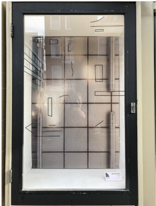
Angle II, 2020 Installatie