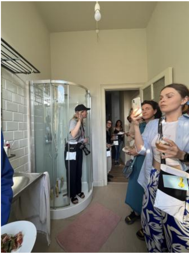
The Residency Tour, 2022 Performance, Stained Glass Window