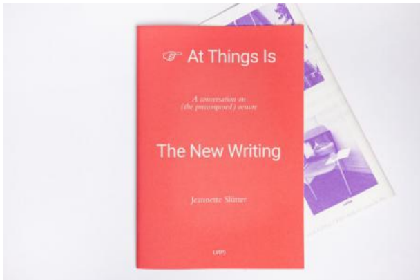
Pointing at things is the new writing, 2023 Publication