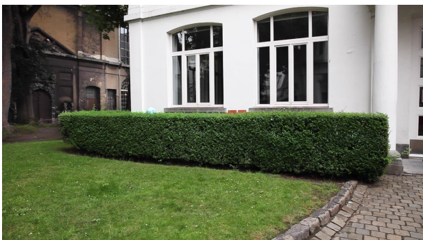
I found a shortcut through your hedge, 2021