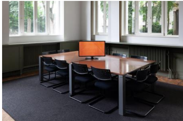
I found a shortcut through your hedge, 2021