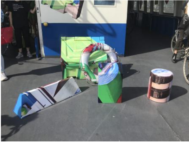
Verdwaal van hier naar daar vandaan dwaal af, 2022 Objects, Photoprint