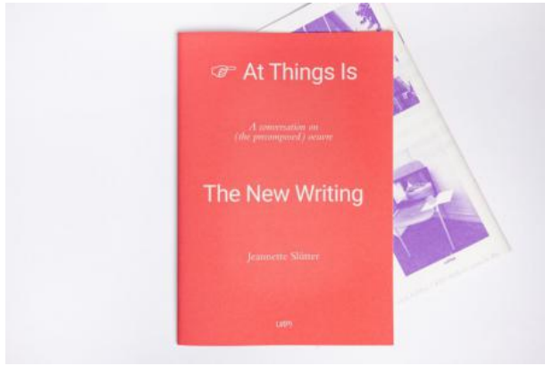
Pointing at things is the new writing, 2023 Publication