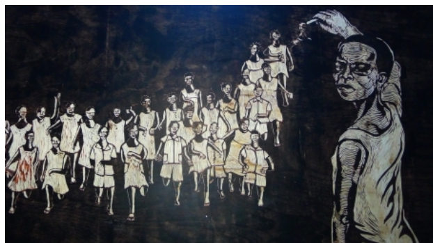
La leçon uniforme, 2015 Installation. Blackboard engraved and sc, -