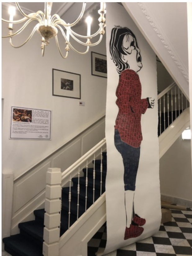
Migración: juego de niños, 2019 Collage, prints + stencil op papier, 400 x 132 cm