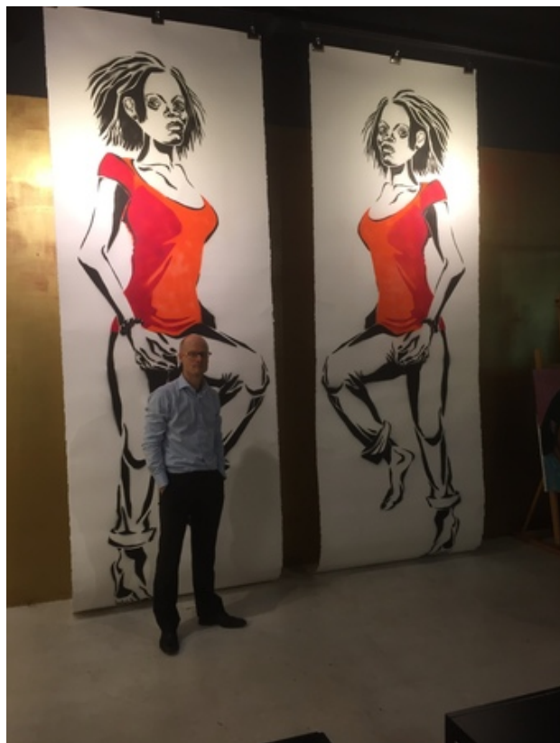
Danseuses, 2017 Stencil graffiti op papier, 400 x 132 cm