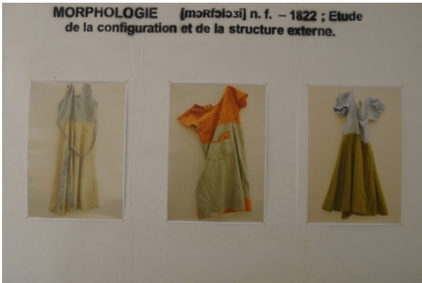
Morphologie, 2014 Installation: photos, stencil, woodcuts a, -