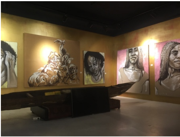
Perspectives on departure, 2016 Mixed, Overview