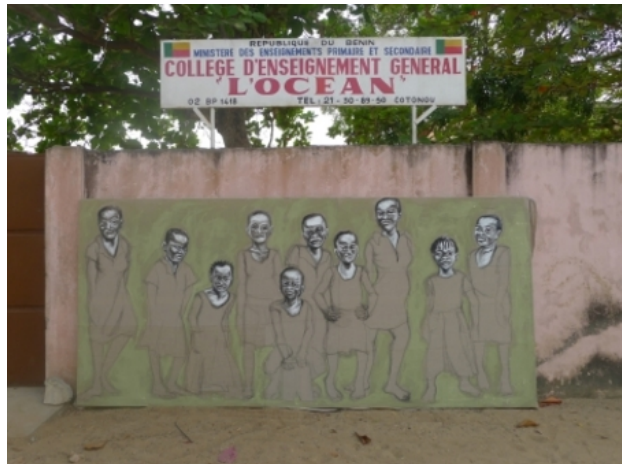
Filles en uniforme, 2015 Acrylics on Canvas + performance and vid, -