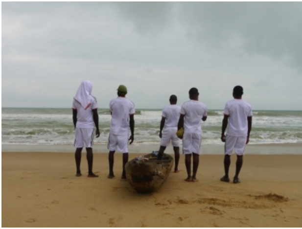
Lampedusa, 2015 Video Installation and photos, -