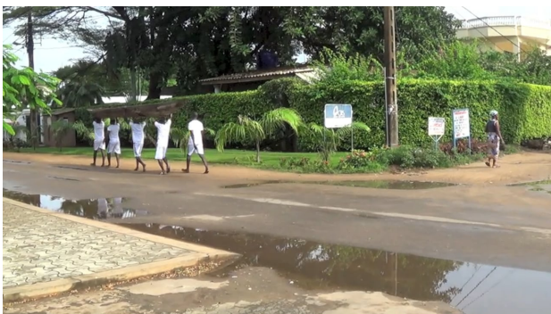
Lampedusa, 2015 9 min