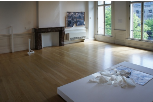
Foam 3h, 2019