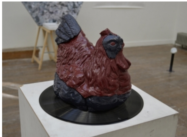
YJK, 2013 Gips en lakverf, 20 x 25 x 15 cm