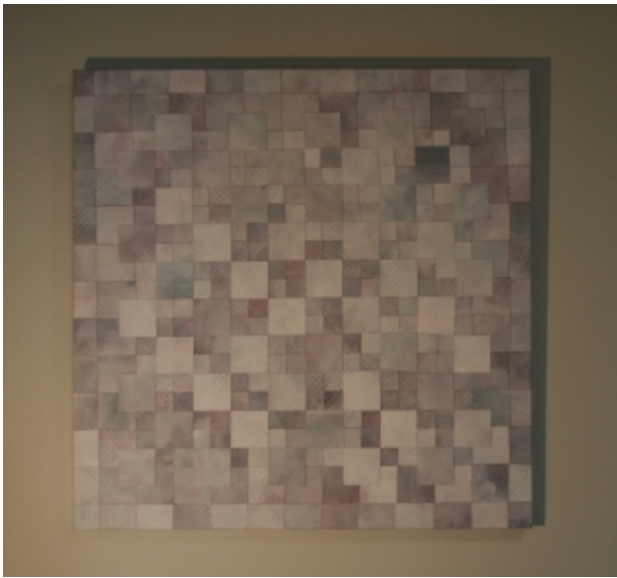
No.67, 2015 Canvas, lijm en olieverf op hout, 52 x 52 cm