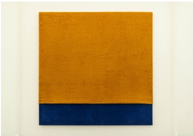
Sleep well, 2014 Stof op frame, 200 x 200 cm