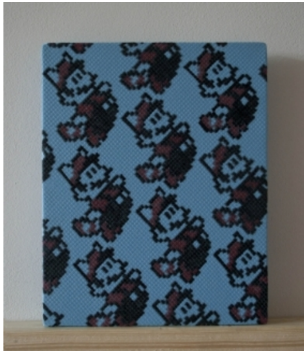
For the love of Mario, 2015 Inkt op microvezeldoek, 30 x 24 cm