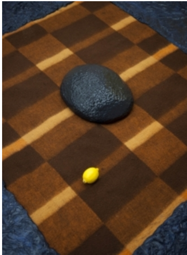
Floor piece no.3, 2015 Beton, klei, lakverf, kleed en citroen, 5 x 200 x 200 cm