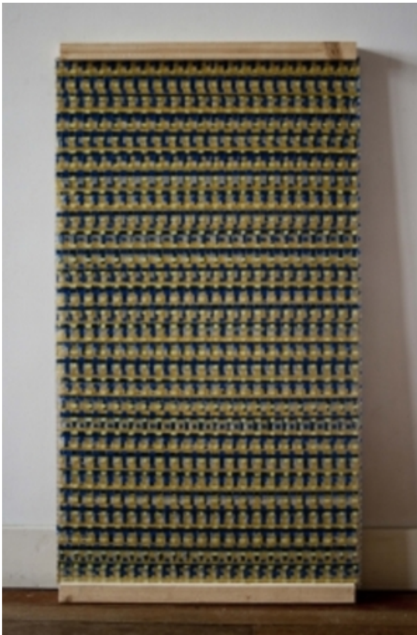
Glass no.2, 2016 Gewapend glas, hout, tape & lakverf, 104 x 58 cm