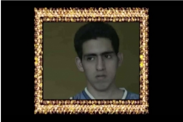
The Finger, 2016 video, 2 min