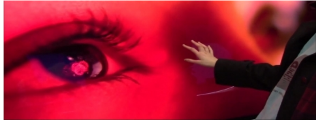
The Transhuman, 2016 film, 5 min