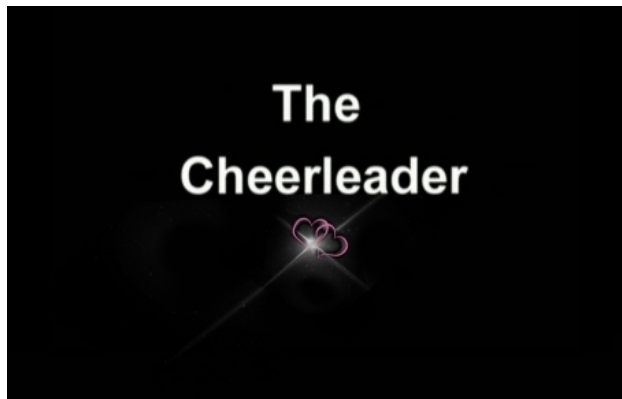
The Cheerleader (Prologue), 2017 video, 5 min