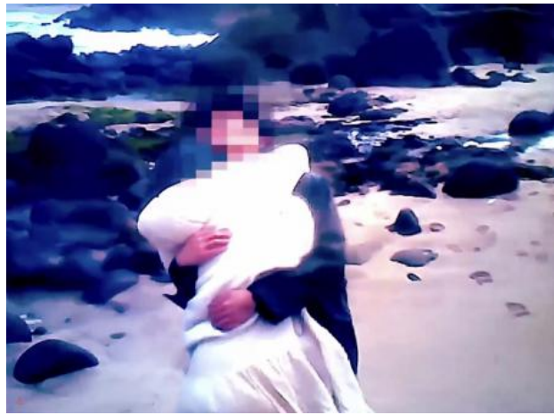
Eclipse, 2021 Video