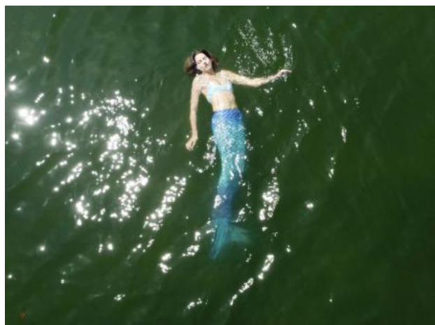
+/-, 2022 Video