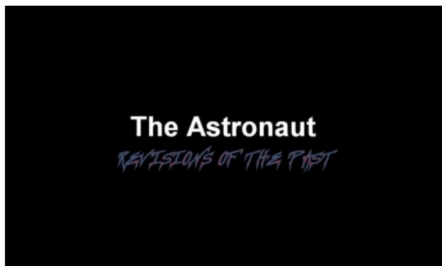
The Astronaut: Revisions of the Past, 2016 video, 5 min