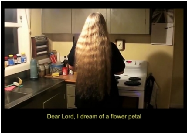
The Mother, 2015 video+super 8, 2 min