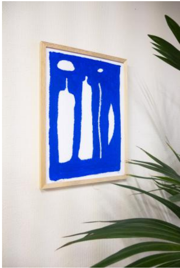
Blue Balance 9, 2024 Oliekrijt op recycled papier, 29,7 x 42 cm