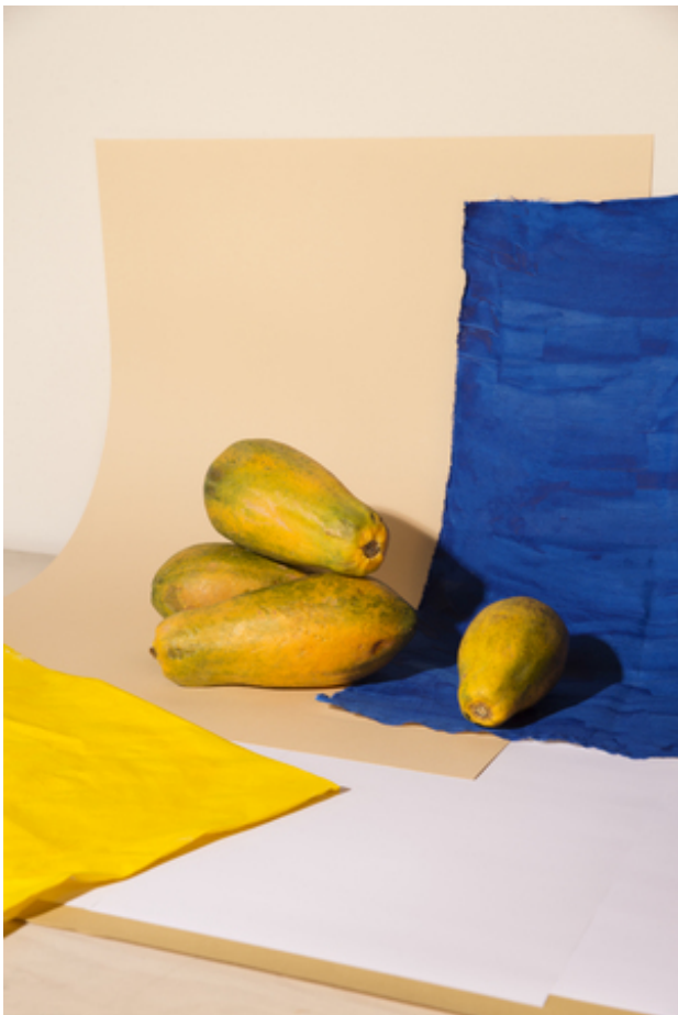
About me videos