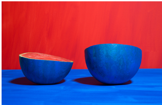
Blue Watermelon, 2017 Fine Art Print, 90x0x64