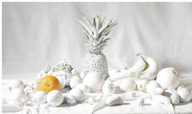
White Composition, 2017 Fine Art Print, 144x0x94