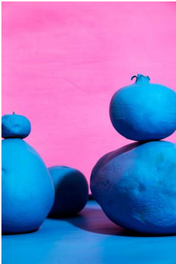
Blue Fruity Landscape, 2022 Fine Art Print Framed, 63 x 88 cm