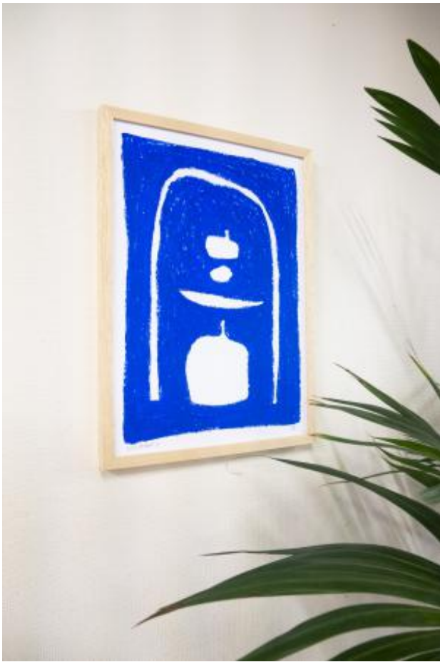
Blue Balance 16, 2024 Oliekrijt op recycled papier, 29,7 x 42 cm