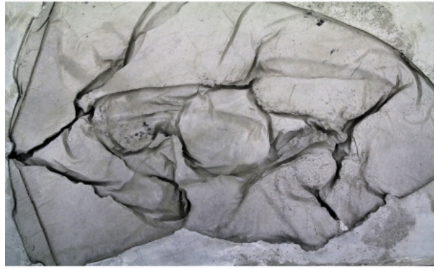
Lay my burden down concrete casting, 350 x 175 x 40