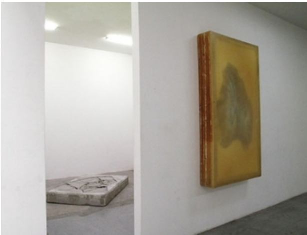
Lay my burden down soap cast, concrete cast, 350 x 175 x 40