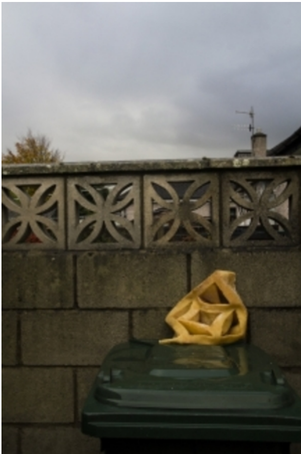
Strickland latex mold, 30 x 30 x 30