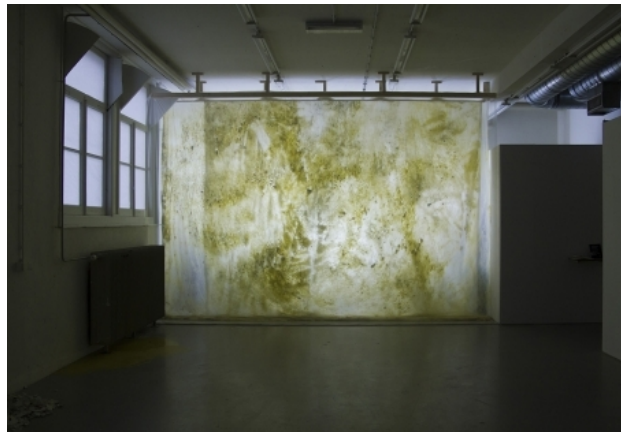
Frontierland (part of installation) margarine, plastic, TL light, 670 x 500