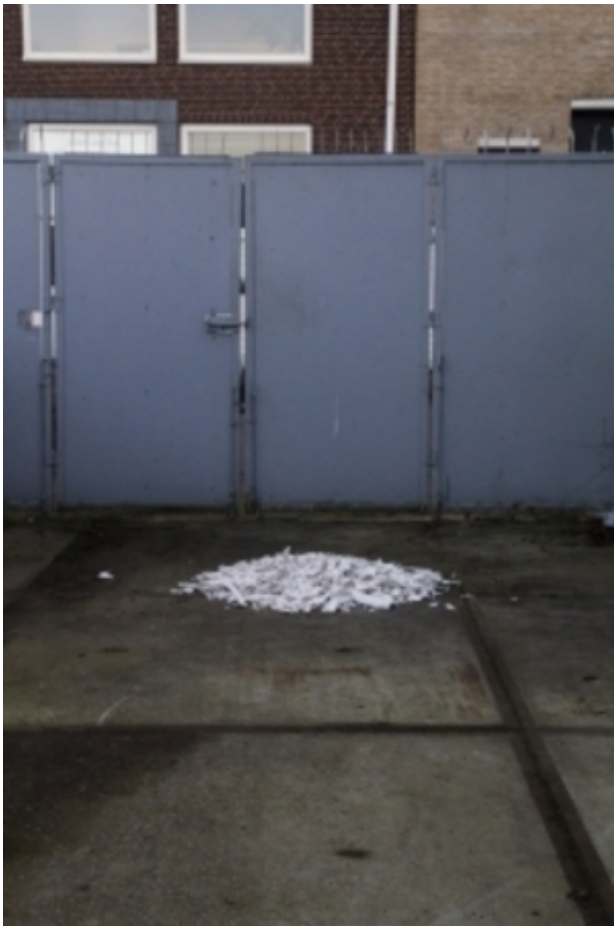
Glory plastic chair- industrially shredded