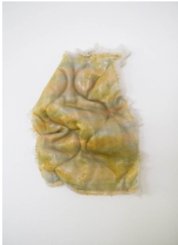
Frontierland (part of installation) latex, embroidery, 20 x 12