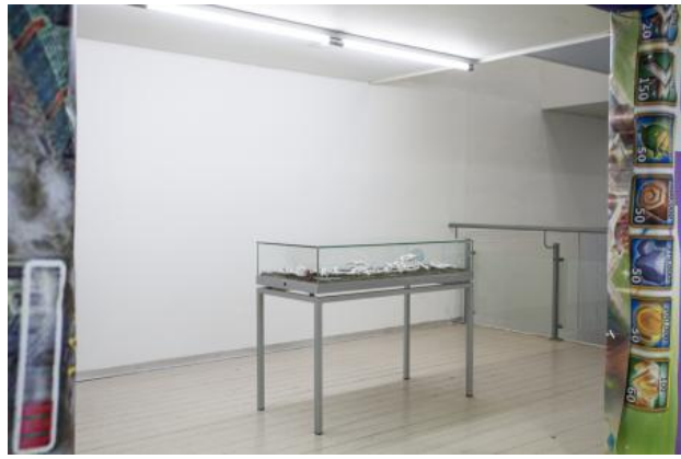
Imprint, 2020 porselein, 150x120x80