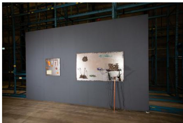
Untitled & Untitled, 2021 staal, keramiek, karton, stickers, olieverf, koper, camera & beeldscherm, 60 x 60 x 5 & 160 x 140 x 5 cm