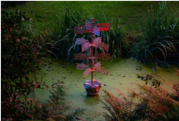
Money Tree, 2021 Koper, keramiek, glazuur, 70 x 70 x 200 cm