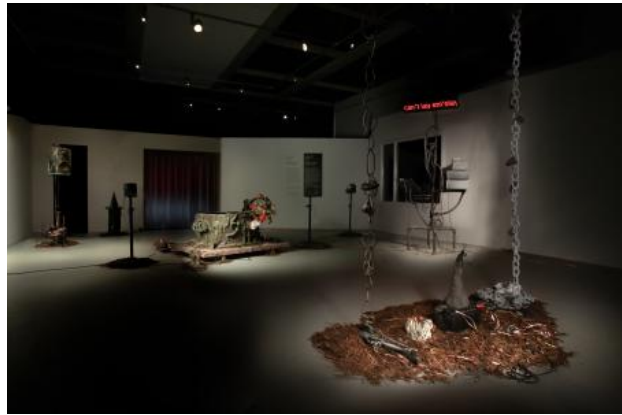
Mimmirsbrunner, 2022 ceramic, sound, sensors, wood, metal