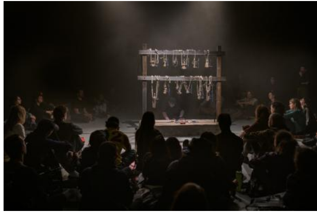
Birth-Elements-One-World, 2024 Wood, bronze, solenoids, electronics, max msp, FDM print, rope, 20 × 200 × 80 cm