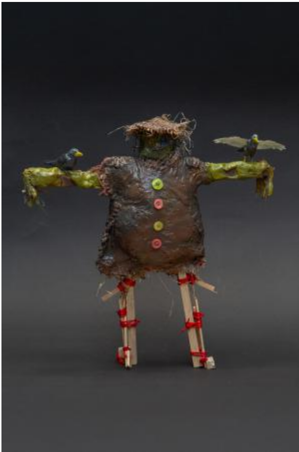
Scarecrow, 2023 wood 3D print, epoxy clay, jute, straw plaster, rope knots, paint, 33 × 38 × 8 cm