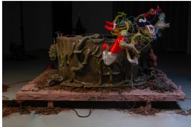
Mimmirsbrunner, 2022 keramiek, 3d print, hout, servo motors, raspberry pi, airbrush, arduino, wires, 160 x 160 x 80