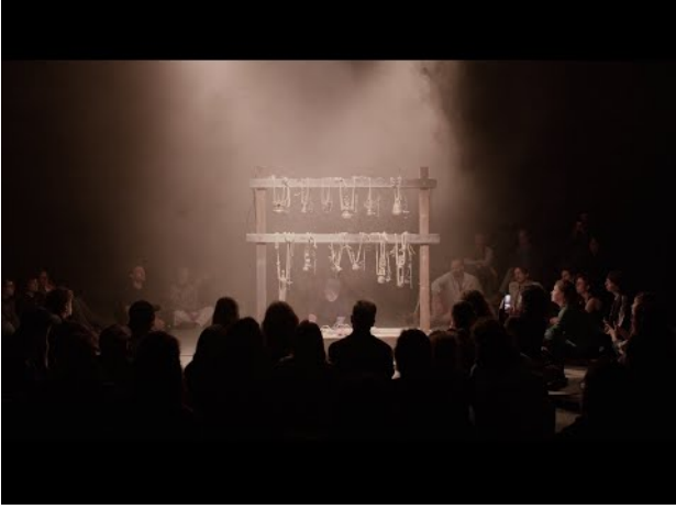
Birth-Elements-One-World, 2024 15:25