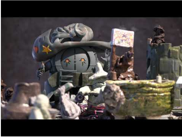
Komt TIDE Komt RAET, 2020