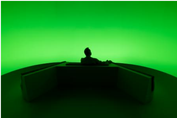
Chasing The Dot, 2024