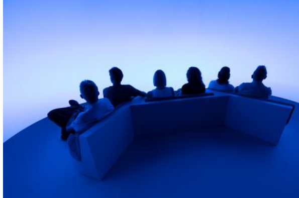
Chasing The Dot, 2024