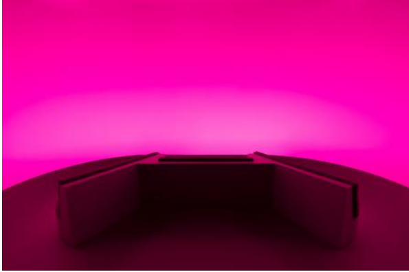
Chasing The Dot, 2024