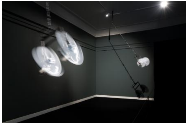
Flying, 2024 Motors, elastics, speakers, cables, amplifier, metal