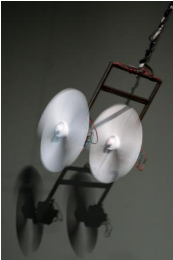
Flying, 2024 Motors, elastics, speakers, cables, amplifier, metal