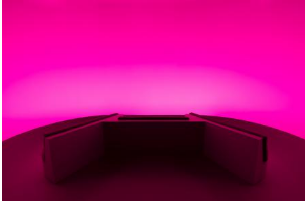
Chasing The Dot, 2024