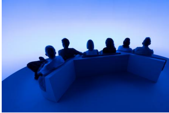
Chasing The Dot, 2024