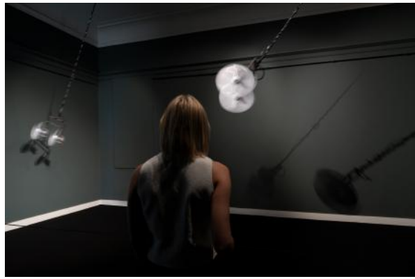
Flying, 2024 Motors, elastics, speakers, cables, amplifier, metal