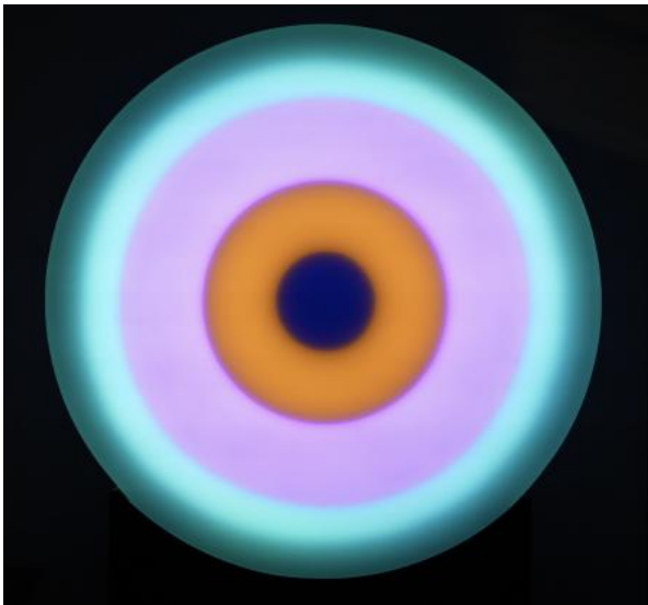
Here You Are, 2024