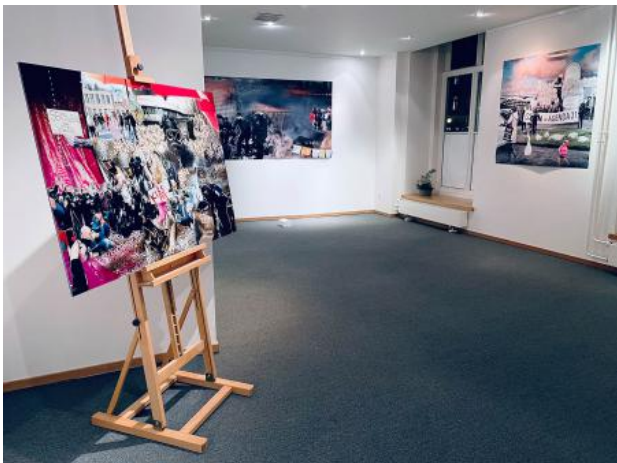
Reality seems well defined, 2021 Diasec, 120 x 80 cm