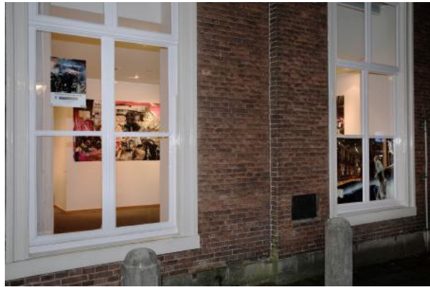
Reality seems well defined, 2021 Prints, divers