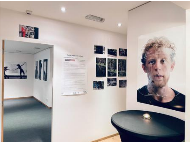
Reality seems well defined, 2021 prints, divers