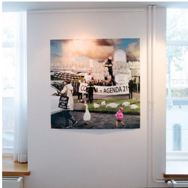
Reality seems well defined, 2021 Print, 120 x 120 cm