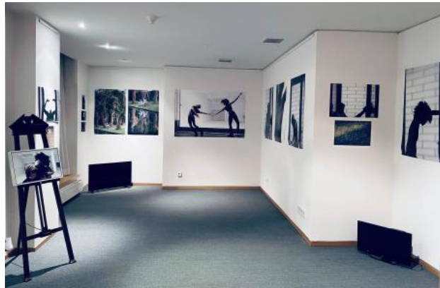
Reality seems well defined, 2021 prints, divers