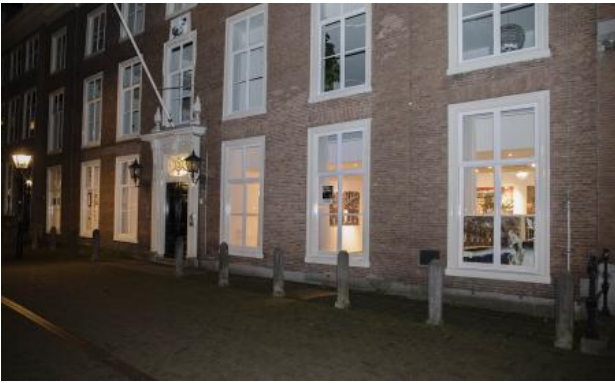
Reality seems well defined, 2021 prints, divers