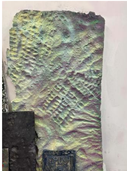
Atlantis WallN5, 2023 mixed media, 5x100x100