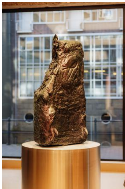
□ , 2023