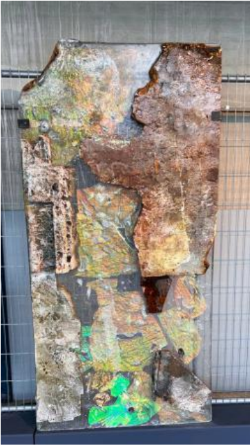
Atlantis temple N1, 2023 mixed media, 3x100x200