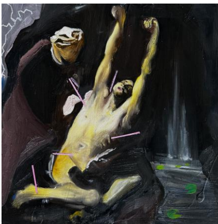
Sebastian and Lilies, 2023 60 x 60 x 5 cm, 60 x 60 x 5 cm