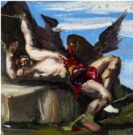
Prometheus, 2023 60 x 60 x 5 cm, 60 x 60 x 5 cm