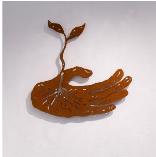
Ontkiemen, 2023 Cortenstaal, 72 x 74 x 3,5 cm