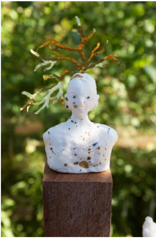
Me, 2023 Porselein en messing, 13 x 25 x 8