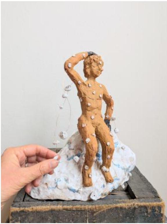
ik sneeuw, 2025 Klei, koperdraad, 24 x 15 x 27