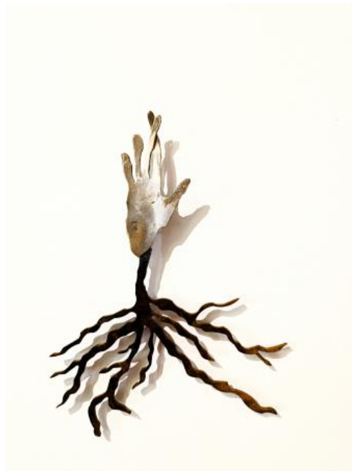
Rooted Hand, 2024 Porselein, klei, cortenstaal, 34 x 4 x 45