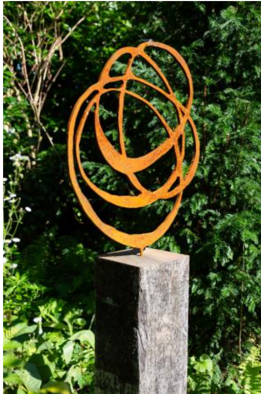
Door de nacht, 2023 Cortenstaal, 43 x 50 x 0,12