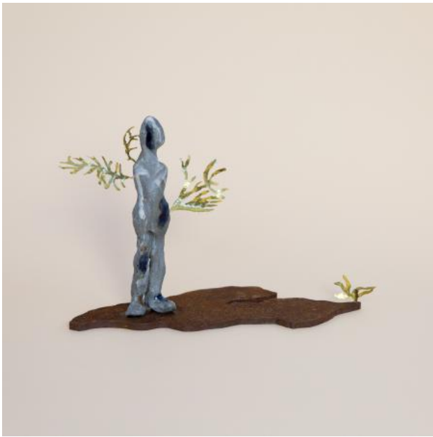
Dat ik je droom, 2023 Klei, porselein, messing en cortenstaal, 19 x 11 x 27