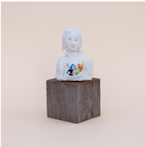
Future me, 2023 Porselein, 10 x 7 x 4,5