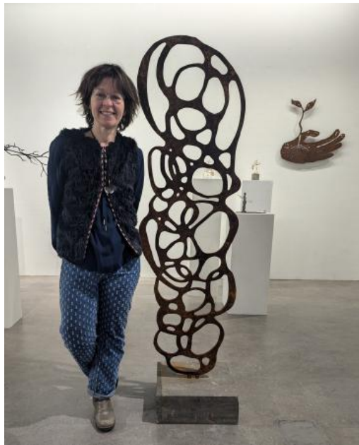
ik adem, 2023 cortenstaal, 50 x 1,2 x 166