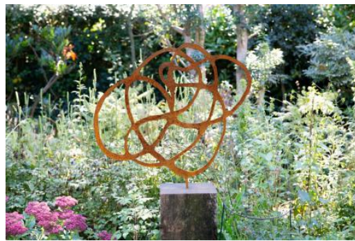
Droom me, 2023 Cortenstaal, 62 x 55