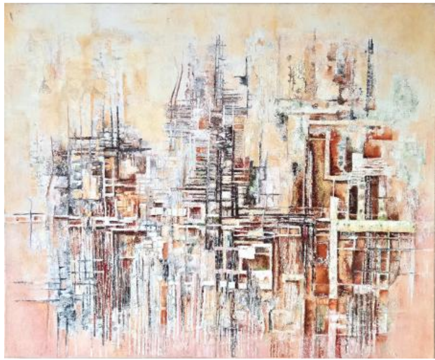
Constructions, 2018 Mixed media, 90 x 90 cm