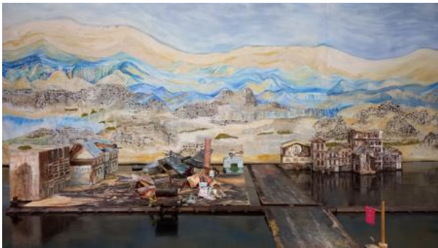
Sloebertown, 2023 Mixed media, 100x100 x80

2011 - begeleider Wandschildering st. Anton 2019 Constandse Loopt nog