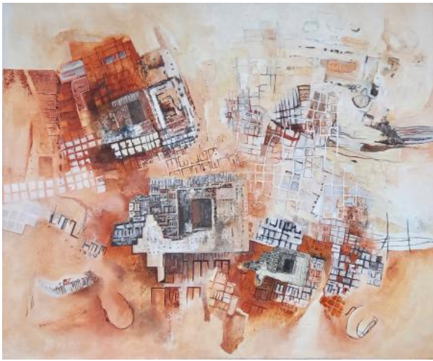
Art museum, 2022 mixed media, 80 x 100 cm