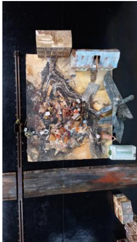
Spoorlijn, 2023 Mixed media,, 200 x 200 cm