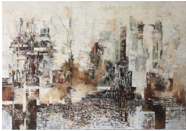
River city, 2021 olieverf , 100 x70cm