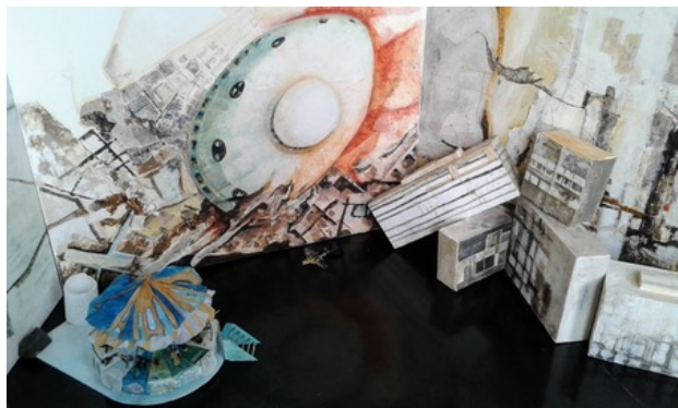
Aliens en De Mallemolen, 2018 Doek, karton, mixed media, 250x250 x 100