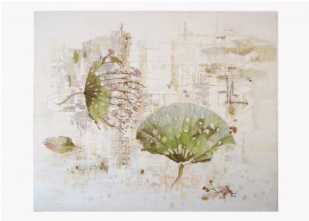
Bries, 2020 Mixed media, 100 x 120