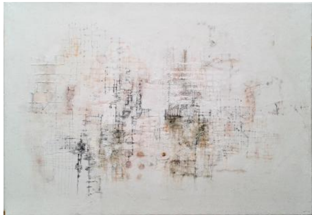
Grid I, 2021 mixed media op doek, 70 x 100