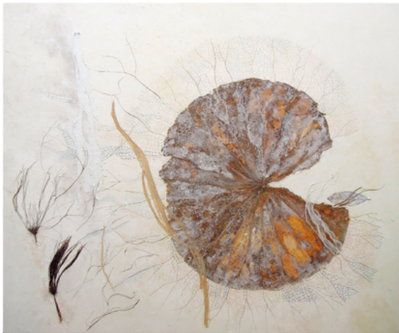
Floating II, 2018 Mixed media, 120 x 100