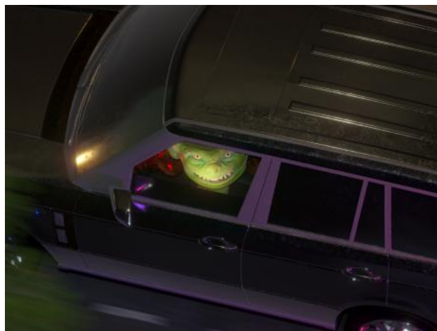
Goblin attitude, 2020 videostill, 41 sec videoloop