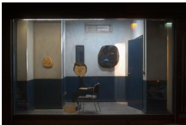
The Box (overview), 2022 mixed media, 420cm x 300cm x 250cm