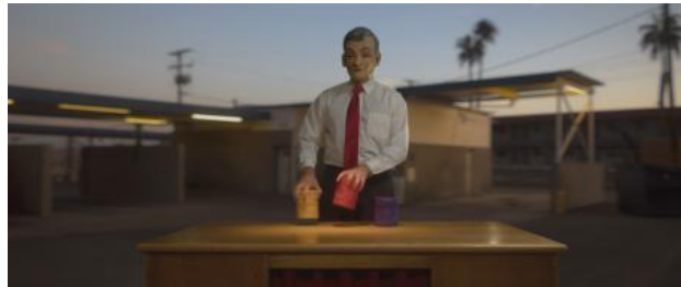
Fragment of 5000 Miles: The Conjuror, 2021 videostill, 1min20s