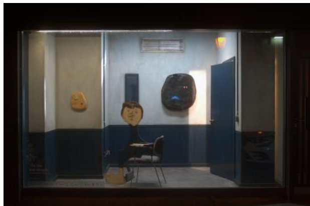
The Box (overview), 2022 mixed media, 420cm x 300cm x 250cm