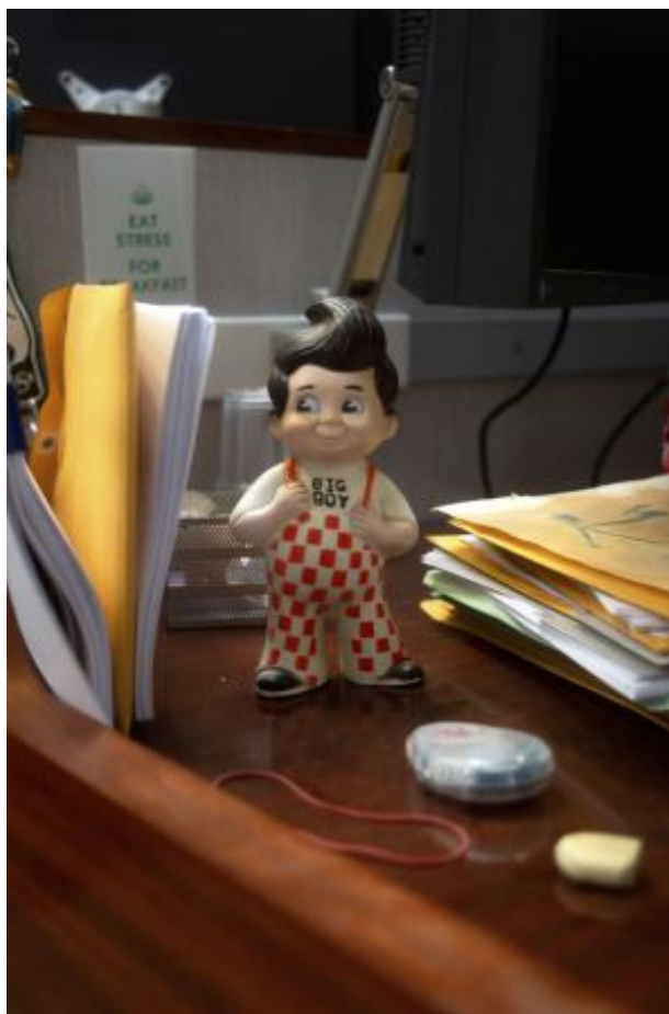
Black Rock, Soft Storm (detail), 2023 multichannel video installation, 600cm x 350cm x 300cm