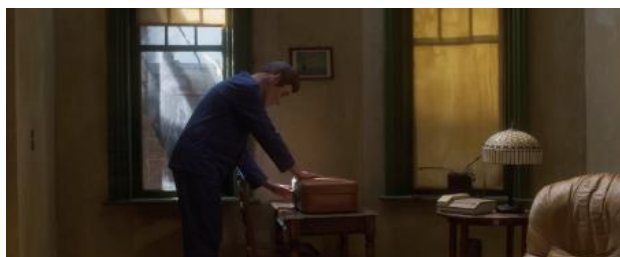
Black Rock, Soft Storm (videostill), 2023 multichannel video installation, 600cm x 350cm x 300cm