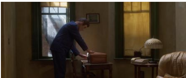
Black Rock, Soft Storm (videostill), 2023 multichannel video installation, 600cm x 350cm x 300cm