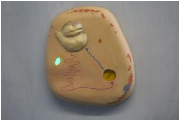
The Box (detail), 2022 mixed media, 420cm x 300cm x 250cm