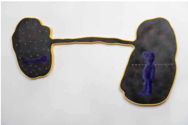
Texas Switch: Bellow, 2021 olieverf, spuitverf, printer-inkt, plexiglas en kunststof profiel, 130cm x 65cm x 3cm