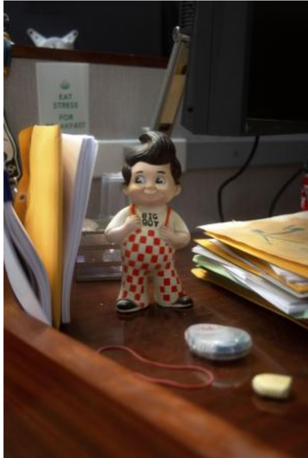
Black Rock, Soft Storm (detail), 2023 multichannel video installation, 600cm x 350cm x 300cm