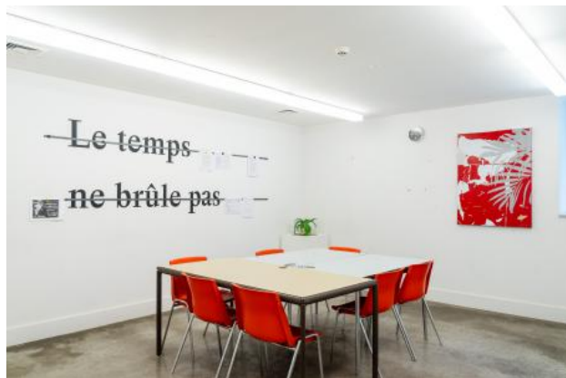
Le temps ne brûle pas, 2023