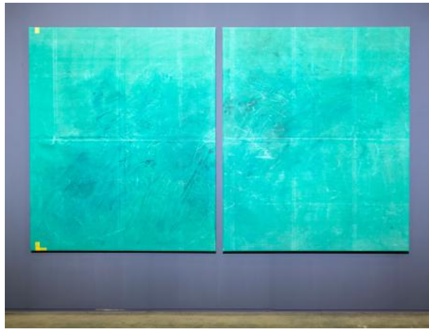
Diptyccocorico from the pond, 2024 heavy duty PVC, ink and tape on aluminum stretchers, 180 x 300 cm