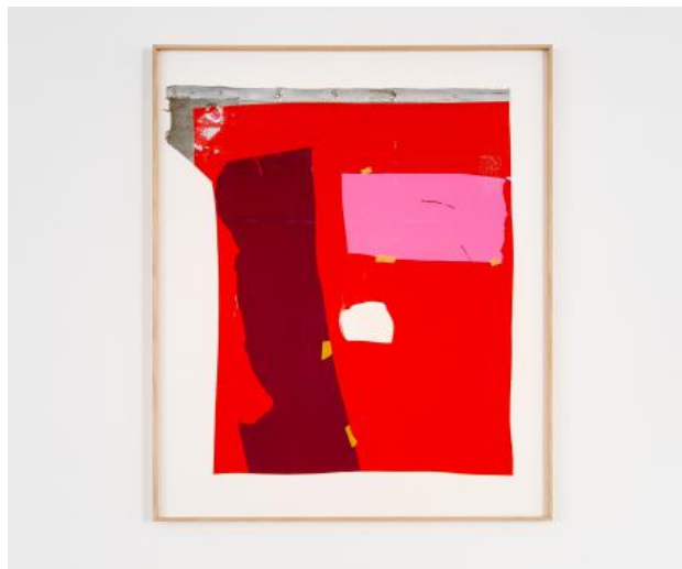
Familie en vis drie dagen [...], 2023 Heavy duty PVC and vinyl. Frame, oak veneer, UV Glass 70%, 74,5 x 89 cm