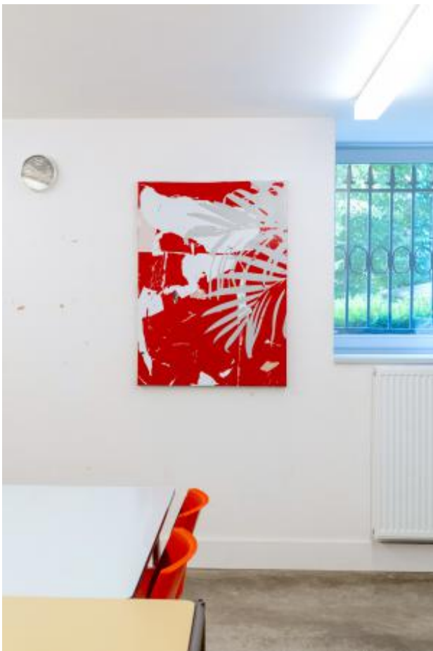
Le temps ne brûle pas, 2023 Zelfklevend vinyl op zwaar zeildoek, 110 x 80 cm