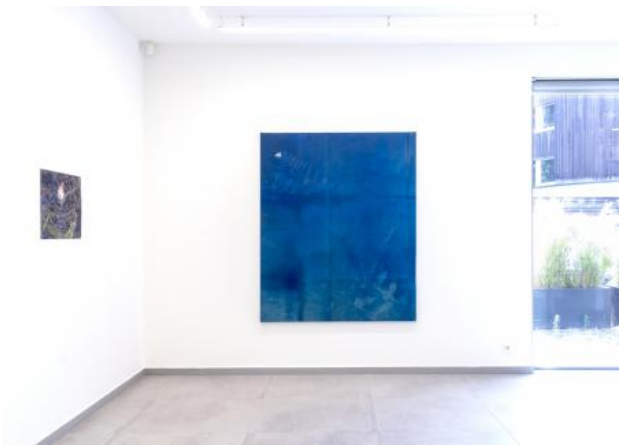
Kantoor Blauw, 2023 Zelfklevend vinyl op zwaar zeildoek, 150 x 180 cm