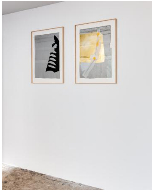
Canary in a gold mine, 2023 Heavy duty PVC and vinyl. Frame, oak veneer, UV Glass 70%, 67 x 89 cm