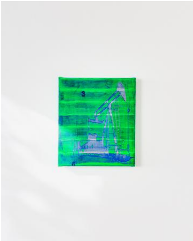
The Pumping Donkey and the Nodding Jack, 2023 heavy duty PVC, oil pastel, vinyl and varnish, 35 x 40 cm