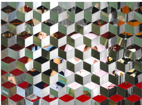
Tesselescence (Woven Photographs) 12, 2021 Ongewenste foto's, archieftape, 17 x 12.5cm