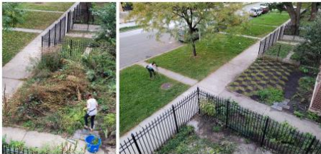
Tesselescence (Garden Apartment Gallery), 2021 Grasverf, graszoden, meerjarige vogel- en vlindervriendelijke zaden, 610 x 610