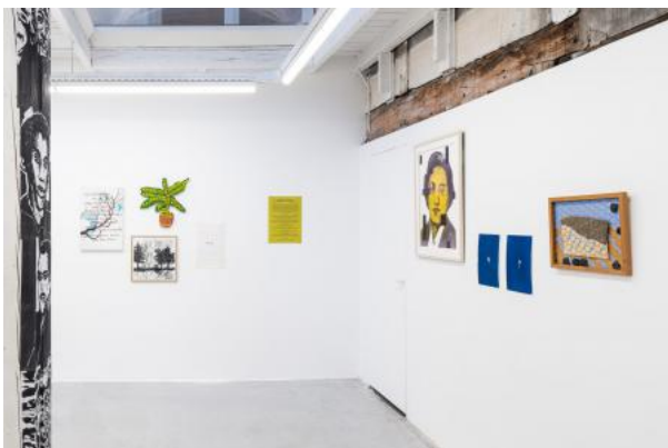
Manifest van het Meersoortig Collectief, 2024