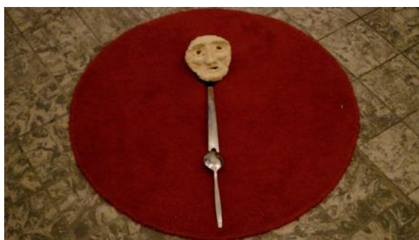
Lady Artist Club, 2019