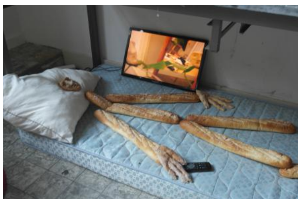
Lady Artist Club, 2019