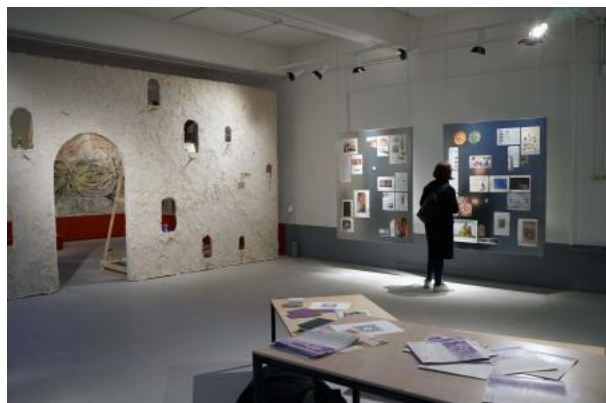
Bericht van de duif, 2024