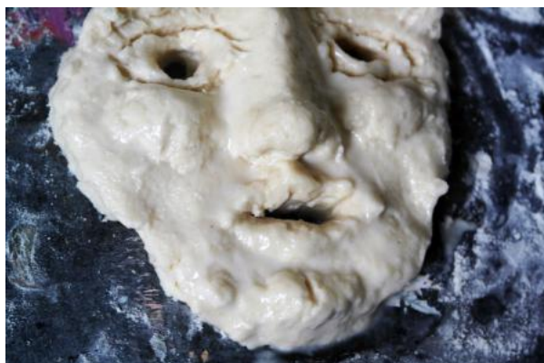
Lady Artist Club, 2019