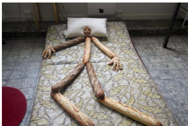
Lady Artist Club, 2019