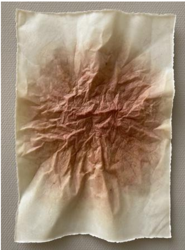
Kaart, 2019 siliconen, katoenvezel, mensenhaar, 58x41x5 cm