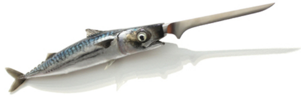
Mesmakreel, 2015 polyester, acryl, polyurethaan, rvs, 9x59x6 cm