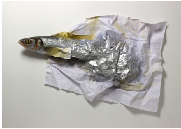
Zeebaarspapier, 2017 polyester, polyurethaan, acryl, papier, 63x39x6 cm