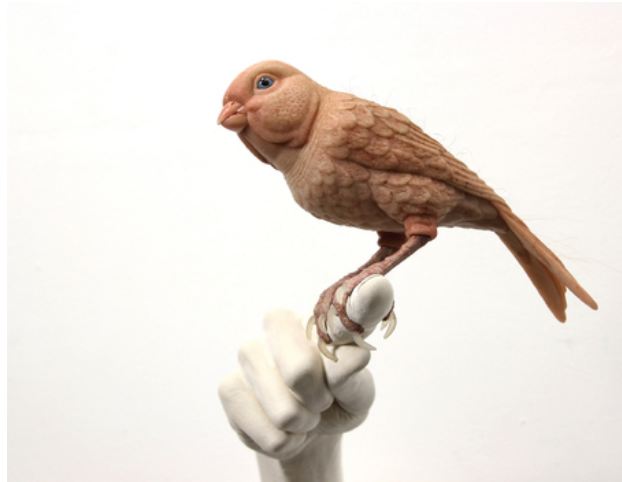
Huidkanarie, 2015 siliconen, polyester, acryl, mensenhaar, keramiekgips, 35x22x34 cm