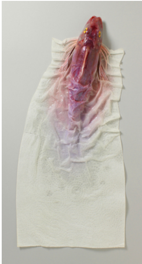
Keukenrolpoon, 2017 polyester, polyurethaan, acryl, keukenrolpapier, 48x23x7 cm