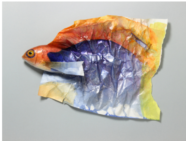
Tweekleurige papiervinvis, 2018 polyester, polyurethaan, acryl, papier, 23x33x4 cm