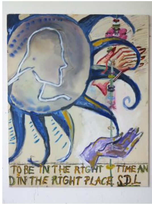
Right Time Right Place, 2023 olieverf, acrylverf op doek, 150 x 130