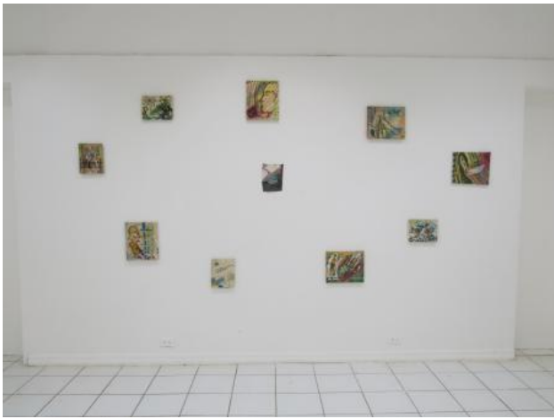
ateliers'89 installatie, 2024