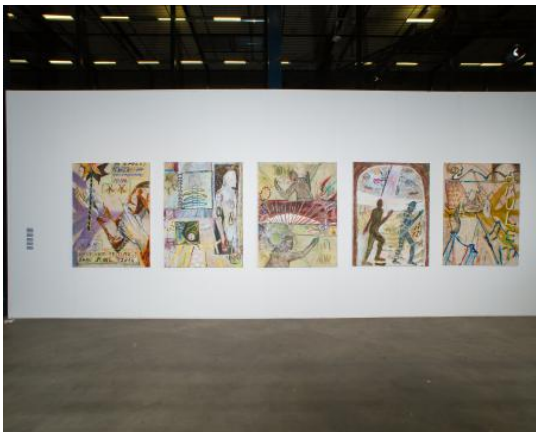
art rotterdam, 2023 olie, acryl, ecoline, pastel, houtskool op doek