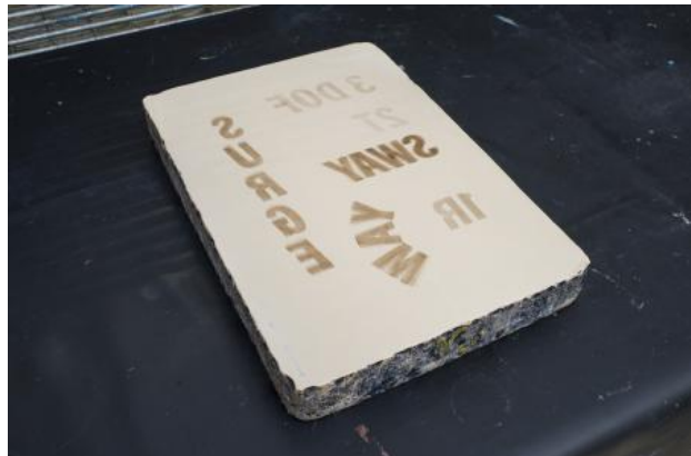
3DOF 2T1R (Rigid body moving through space), 2023 Tusche op Lithosteen, 54x38x7 cm