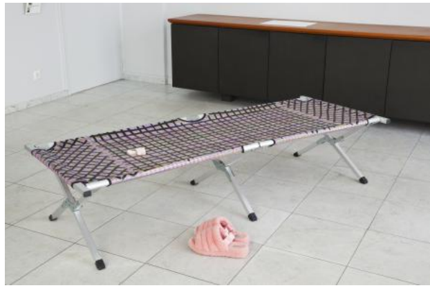
A situation, 2023 Zijde, flexfolie, metaal, giethars, wasbolletjes in katoen, schoenen, 190 x 85 x 43 cm