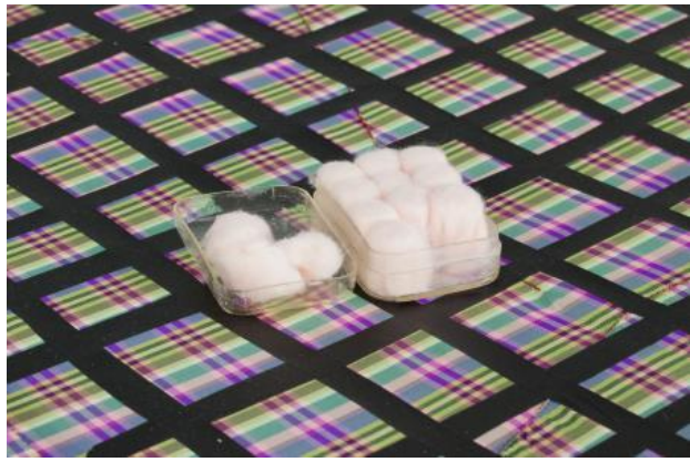
Detail, A situation, 2023 Zijde, flexfolie, metaal, giethars, wasbolletjes in katoen, schoenen, 190 x 85 x 43 cm