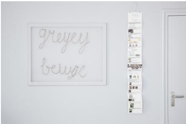
Greyey Beige, 2023 doek: silicone op organza zijde en houten frame. Publicatie: papier, lijm, inktjetprint, guache, vinylsticker en potlood, doek: 75 x 95 cm, publicatie: 128 x 17 cm