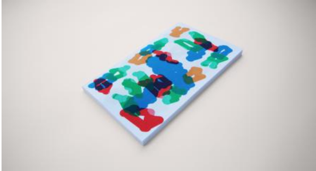
DESETI, 2024 binnenwerk: Riso, cover: zeefdruk, 27 x 16 x 0,7 cm

2021 Pro Invest subsidie Stroom Den Haag Den Haag, Nederland