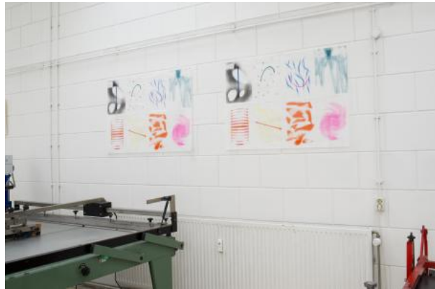
Freedom/Effort (riso), 2023 Riso print op gevouwen Japans papier, 84x118 cm