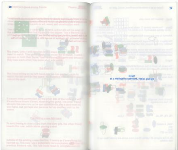
DESETI, 2024 binnenwerk: Riso, cover: zeefdruk, 27 x 16 x 0,7 cm