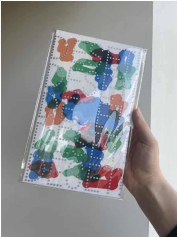
DESETI, 2024 binnenwerk: Riso, cover en hoes: zeefdruk, 27 x 16 x 0,7 cm