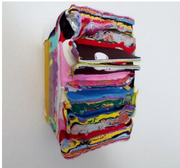
Layers2, 2017 Acrylic and medium on canvas