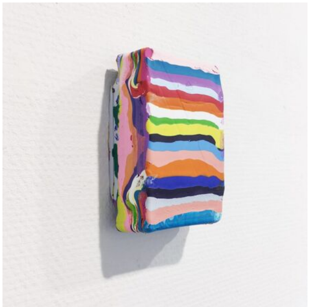
All_lines, 2017 acrylic and medium on canvas