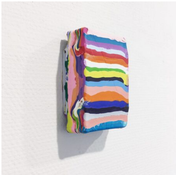
All_lines, 2017 acrylic and medium on canvas