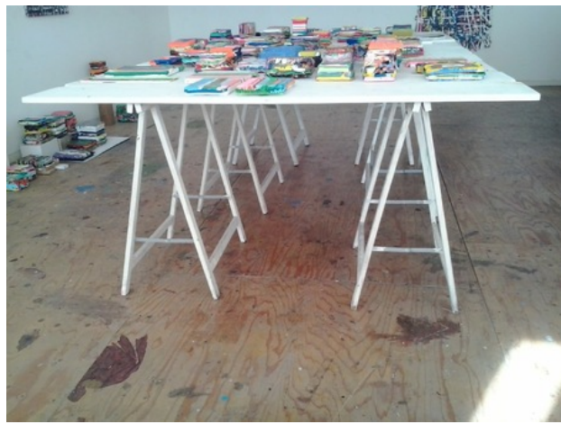
Tafelwerk, 2018 acrylic and medium on canvas