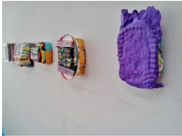
Studio wall, 2018 acrylic and medium on canvas