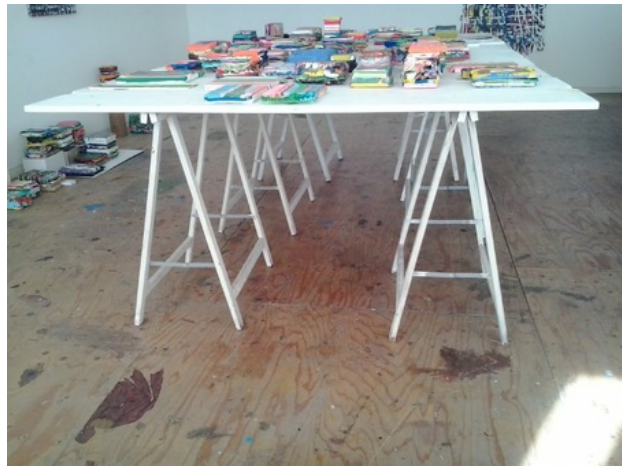
Tafelwerk, 2018 acrylic and medium on canvas