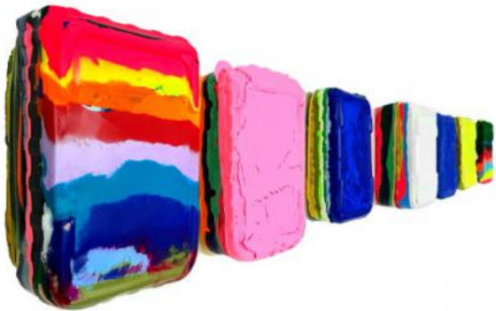
Untitled_series 2021, 2021 Acrylic and plaster / medium on canvas, 17,5 x 12 x 6 cm