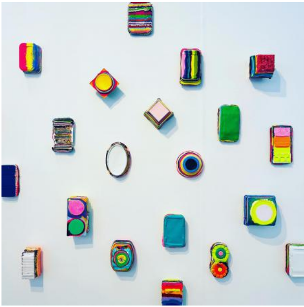
Installatie, 2023 Acryl en medium op doek, Klein formaat