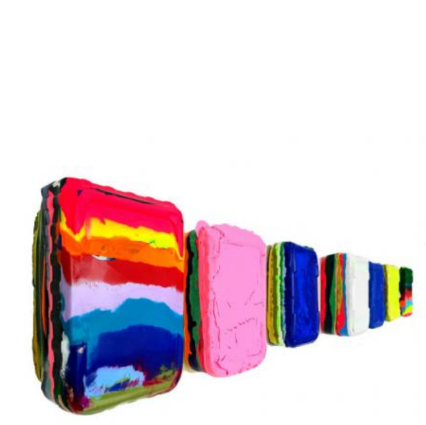
Untitled_series 2021, 2021 Acrylic and plaster / medium on canvas, 17,5 x 12 x 6 cm