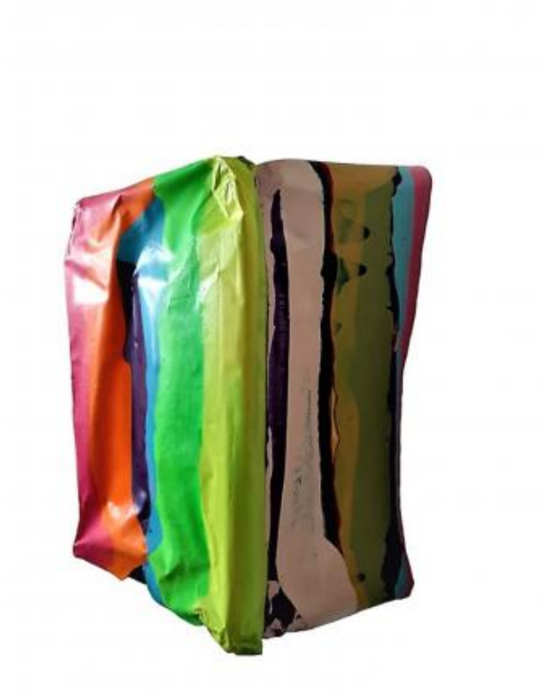
#2 Lines & layers_series 2023, 2023 acrylic and medium on wooden frame, 24 x 18 x 13 cm