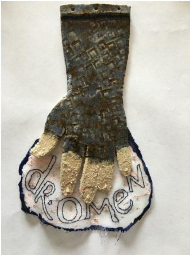
Dr.Omen, 2022 keramiek, textiel, kralen, 18 x 9,5 cm