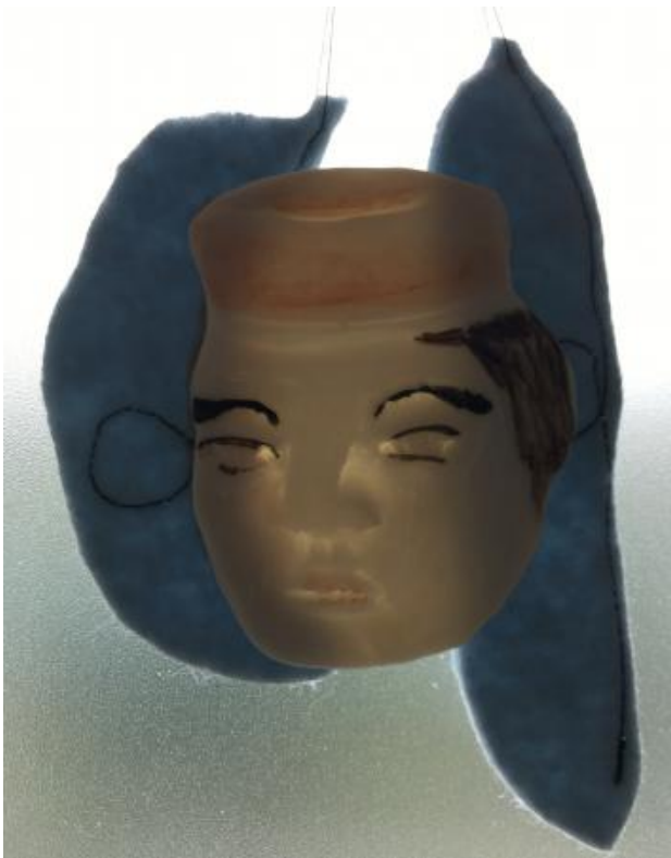
Wachten op Vaderdag, 2022 porselein en vilt