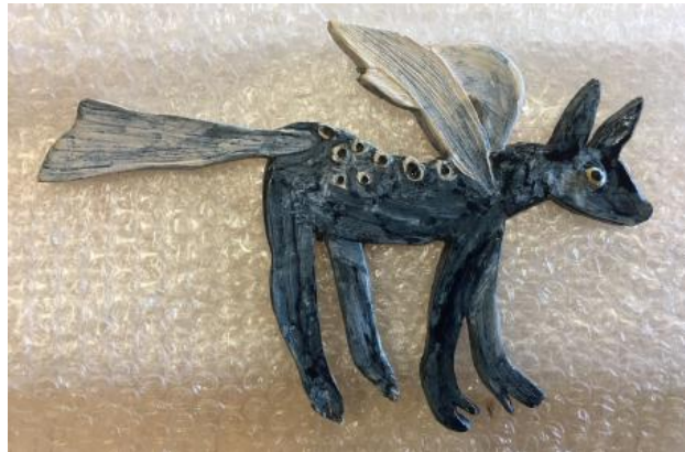
Blue Winged Horse, 2021 kermaiek, 18 x 12 cm