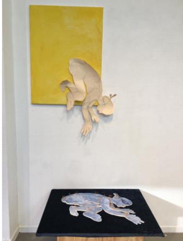
Groom (to be), 2023 keramiek, papier, katoen, metaaldraad, 2x (60 x 80 cm)