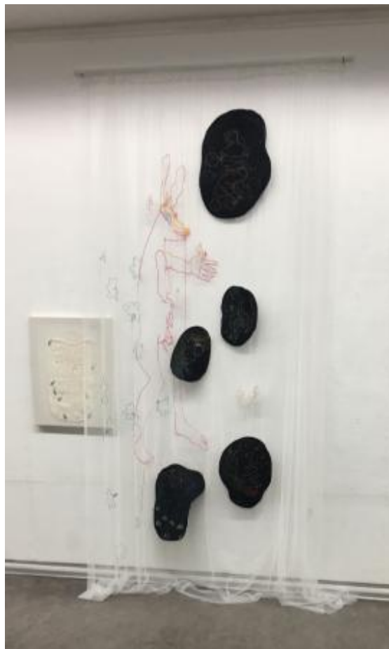
I am dreaming, 2022 borduurcollage, 300cm hoog x 200cm breed