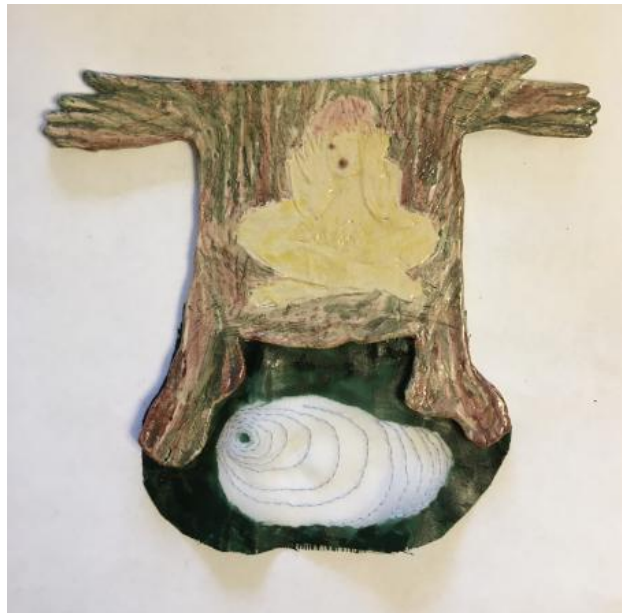
Bosvrouw, 2022 keramiek en textiel, 12,5 x 18 cm