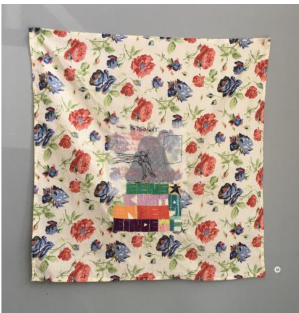
Eens komt er een einde aan de Tijd, 2022 borduurwerk