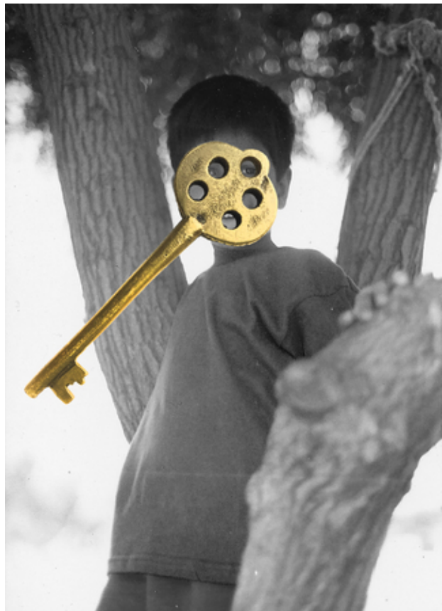
Dadi's Key, 2020