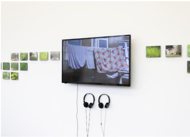
The Empty Bench (installation shot)), 2019