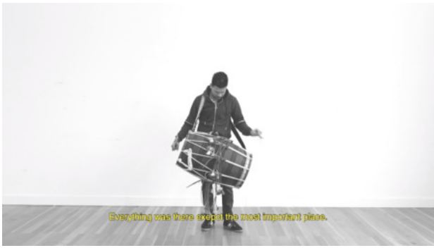
A Place, No Longer (video still), 2019 HD Video