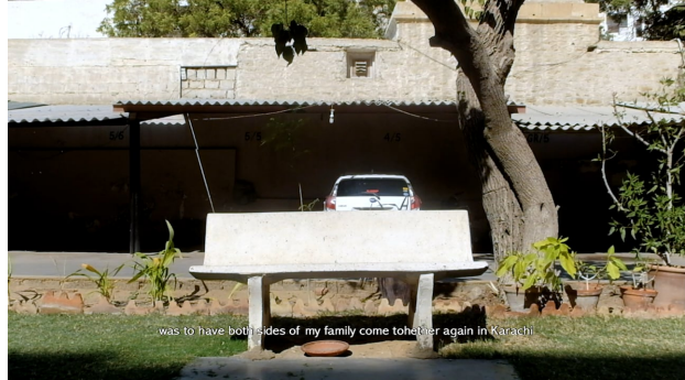
The Empty Bench, 2019 00.55