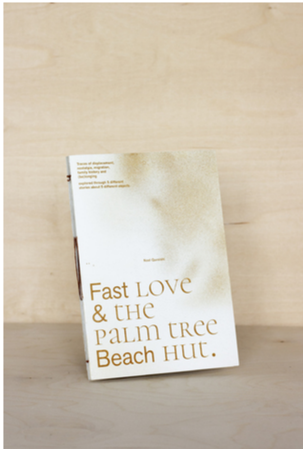
Fast Love and the Palm Tree Beach Hut, 2019 RISO gedrukt in Flat Gold, met de hand gebonden., 24 x 16cm