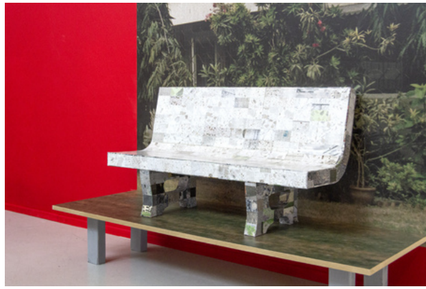
The Empty Bench (Installation Shot) , 2019