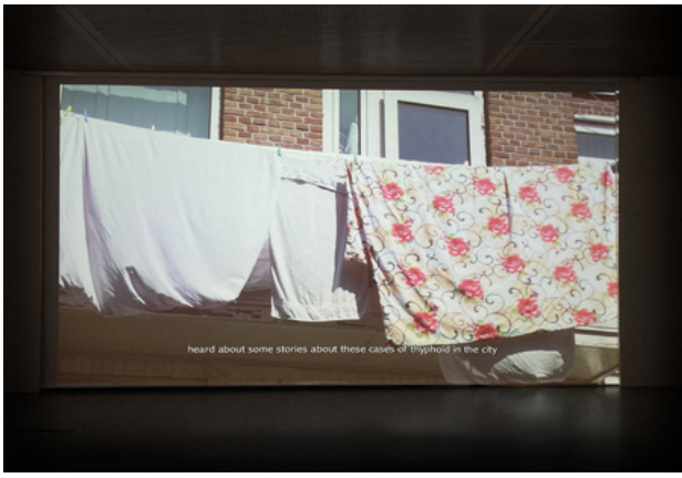
The Empty Bench (installation shot), 2020