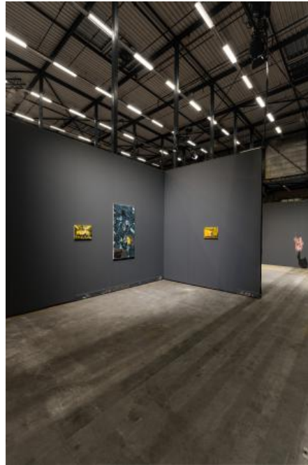
Prospects overzicht, 2024 Schilderijen en plint