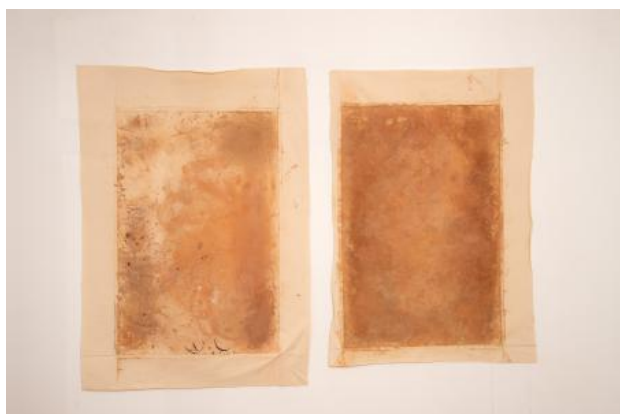
À Volta do Barro, 2025 Klei op canvas, 100 x 150 cm