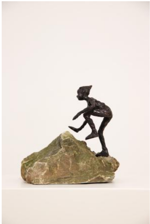
The coloniality of gender, 2025 Brons en steen, 20 x 15 x 15