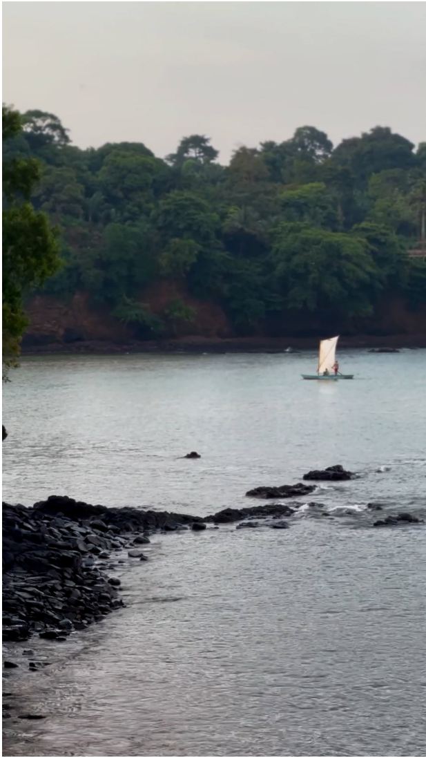
Het dagelijkse leven in Santana, zeilboot, São Tomé, 2024