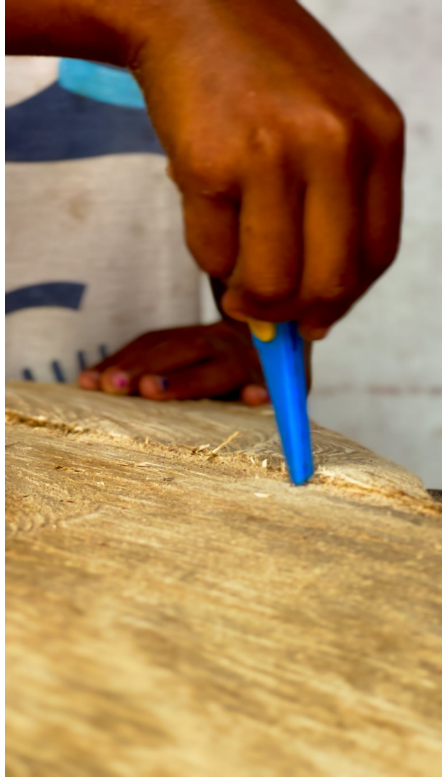
Meisjes maken hun eigen tabua, project O mundo imaginário, Santana, São Tomé, 2024 60 s