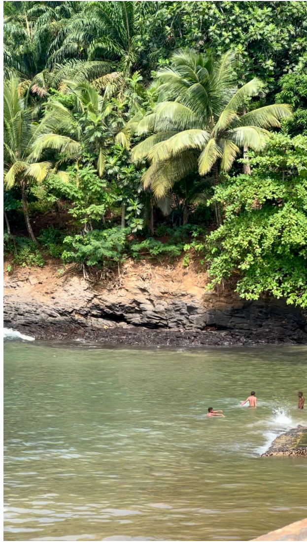
Het dagelijkse leven in Santana, spelende jongens, project The coloniality of gender, São Tomé, 2024 1.30 s