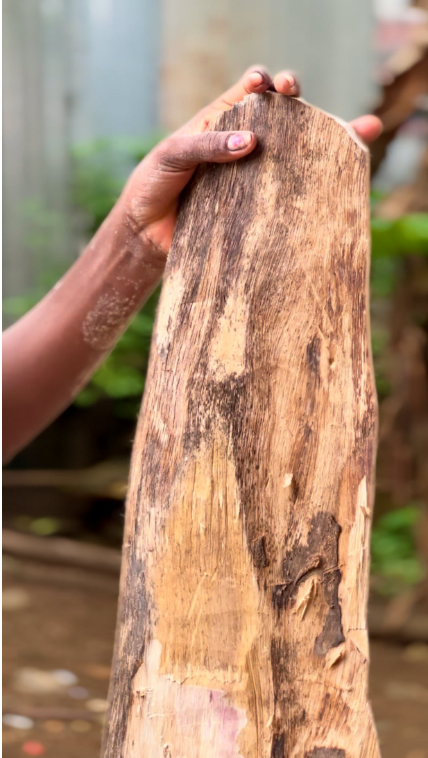
Meisjes maken hun eigen tabua, project O mundo imaginário, Santana, São Tomé, 2024 30 s