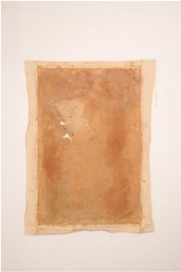
À Volta do Barro , 2025 Klei op canvas, 100 x 150 cm