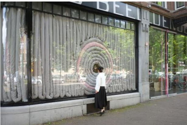
The rest of it is stillness, 2022 textile, patchwork, starch stuffing, 587 x 20 x 131