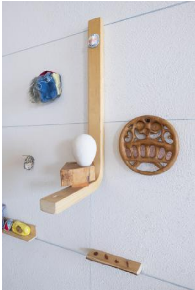
Take my home away, 2022 wood, textiles, ceramics, assorted