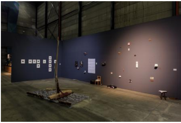
Prospects Art Rotterdam, 2024 installation