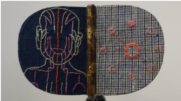
The rest of it is stillness, 2022 embroidery, textile, copper, circuit board and mechanics, 13 x 8 x 35