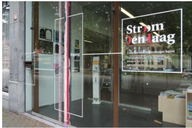
The rest of it is stillness, 2022 textile, site specific installation, 363 x 5 5