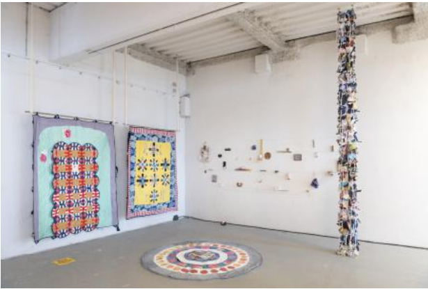
Take my home away, 2022 installation, Textiles, wood, ceramic, paper, 750 x 750