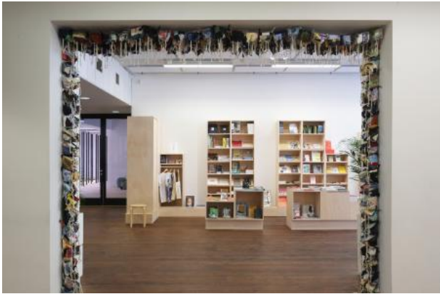
The rest of it is stillness, 2022 textile, site specific installation, 700 x 600