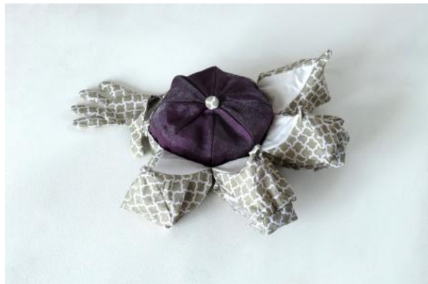
Museum in a hat, 2021 textile, patchwork, synthetic lining, 25 x 25 x 15