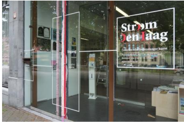
The rest of it is stillness, 2022 textile, site specific installation, 363 x 5 5