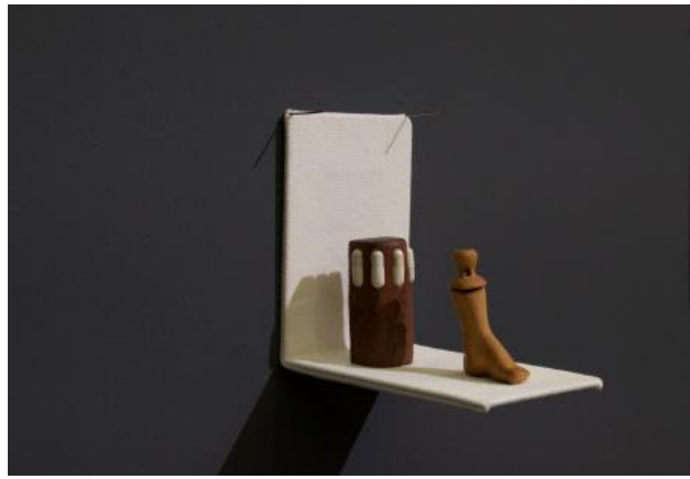
Medication carriers, 2024 wood carving