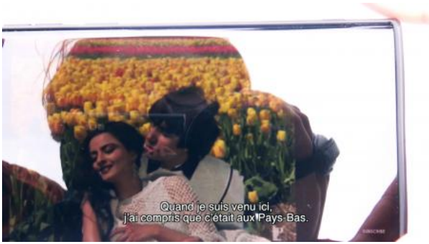
Flowers, 2022 Film, loop, 7 min.