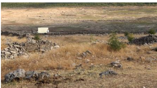
Lake Bottom Cinema, 2023 Film, 25 min.