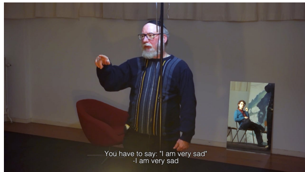
Spiegel (teaser), 2021 01:58