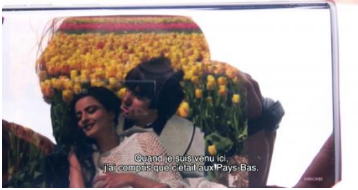
Flowers, 2022 Film, loop, 7 min.