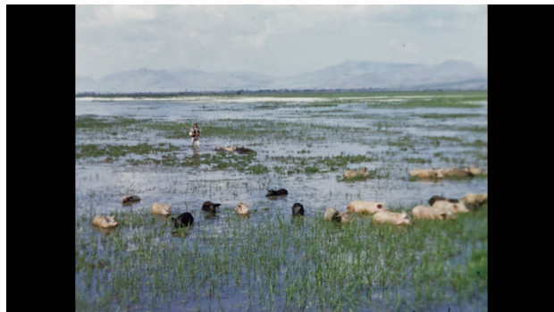
Lake Bottom Cinema (teaser), 2023 01:32