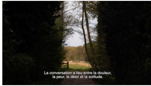
Flowers, 2022 Film, loop, 7 min.