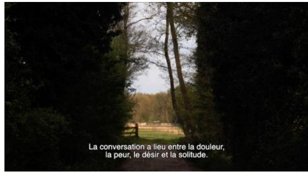
Flowers, 2022 Film, loop, 7 min.