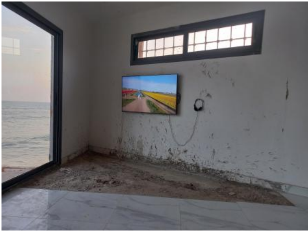
Flowers, 2022 Film, loop, 7 min.