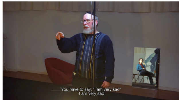
Spiegel (teaser), 2021 01:58