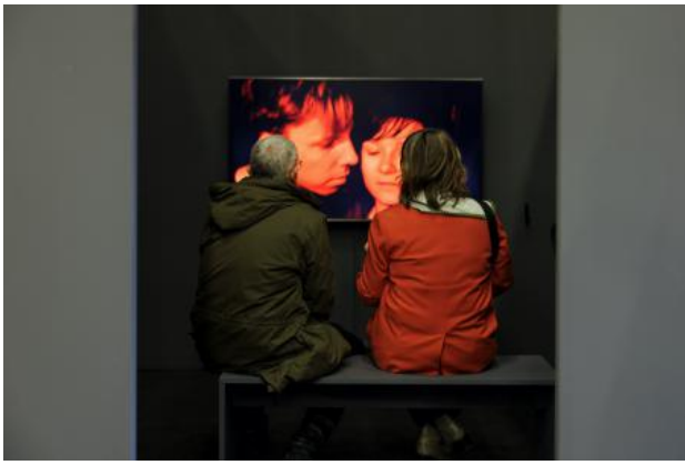
(un)scripted, 2024 Film, 16 min.