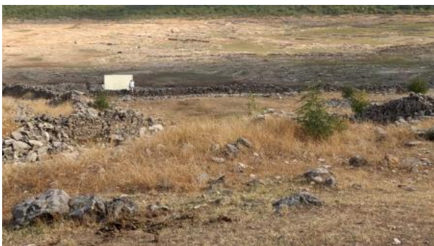
Lake Bottom Cinema, 2023 Film, 25 min.