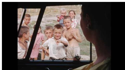
Lake Bottom Cinema, 2023 Film, 25 min.