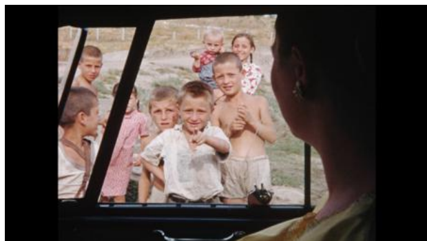
Lake Bottom Cinema, 2023 Film, 25 min.