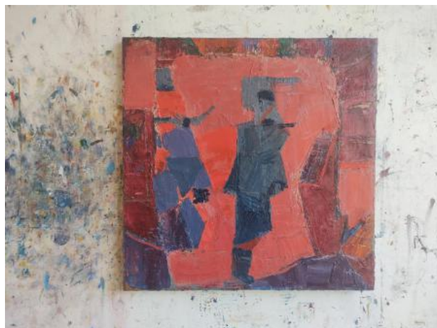
, 2024 Olieverf op doek, 50 x 50 cm