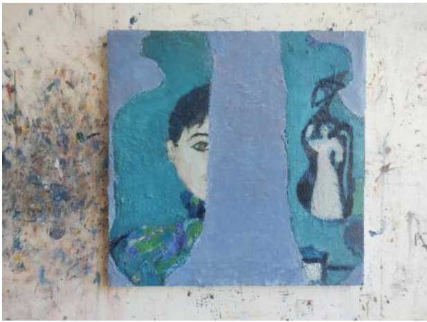
Voorstellingen, 2024 Olieverf op doek, 50 x 50 cm