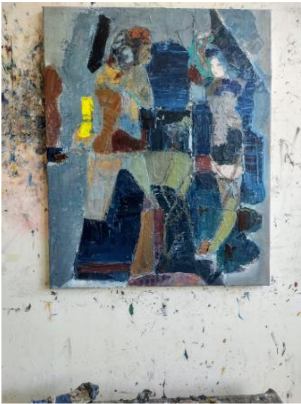
De mooie romance, 2024 Olieverf op doek, 80 x 65 cm