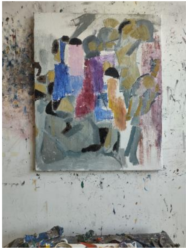
De vrolijke strijd, 2024 Olieverf op doek, 80 x 65 cm