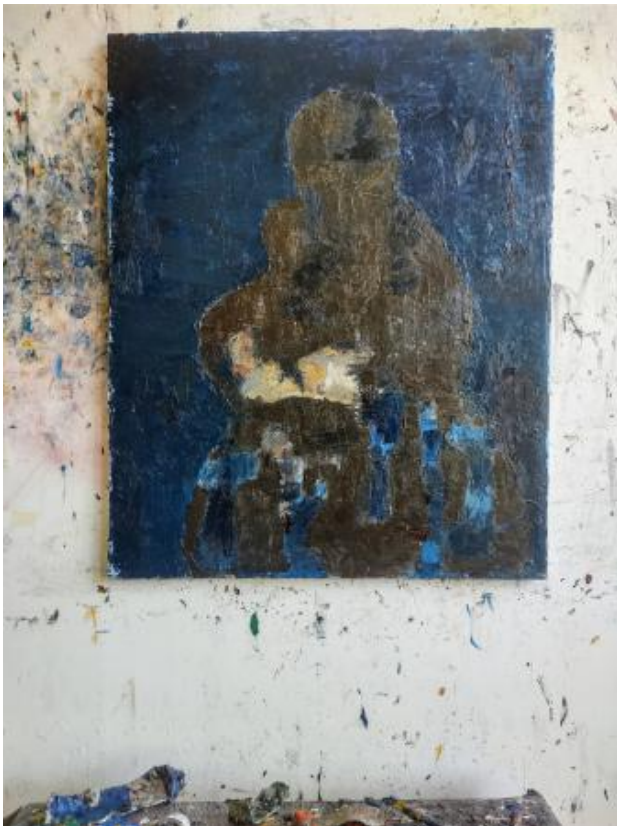
Plaatsnaam, 2024 Olieverf op doek, 80 x 65 cm