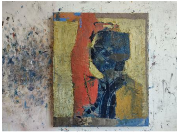
Een artiest, 2024 Olieverf op doek, 60 x 50 cm