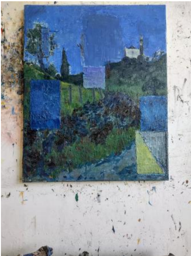
Portugal, onafhankelijk, 2024 Olieverf op doek, 80 x 65 cm