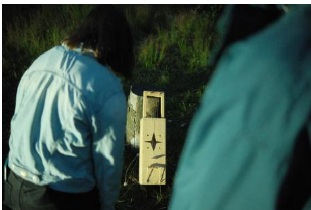
a Piece for a Suit with Bells and an Instrument, 2023 performance, variabel