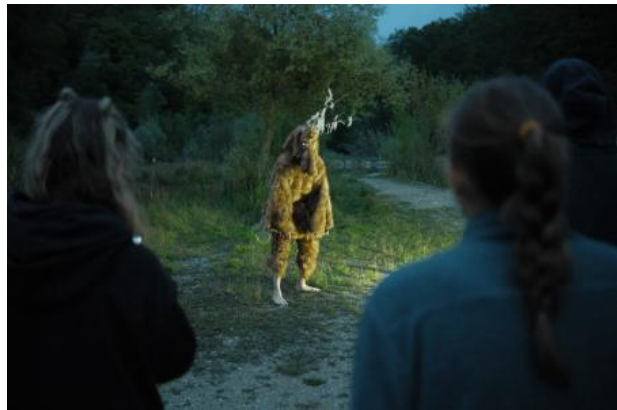
a Piece for a Suit with Bells and an Instrument, 2023 performance, variabel