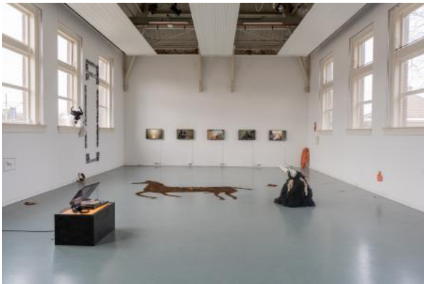
Shimmers///Murmurs, 2024 Audio-visual Installation, varied