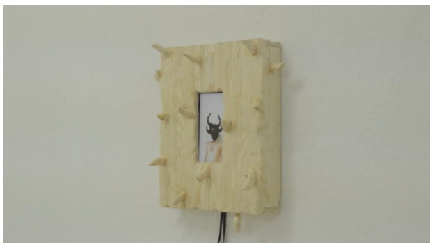
Synthetic Softness, 2024 06:20