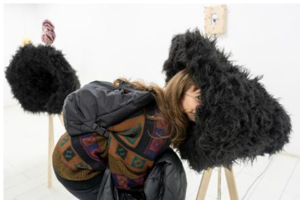
Synthetic Softness, 2024 Audio-visual Installation, 250x325x140cm