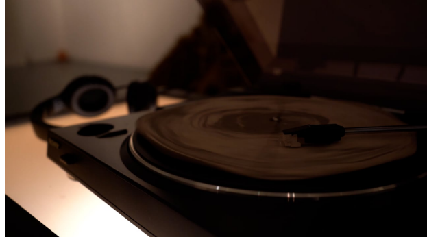
Shimmers///Murmurs, 2024 00:55