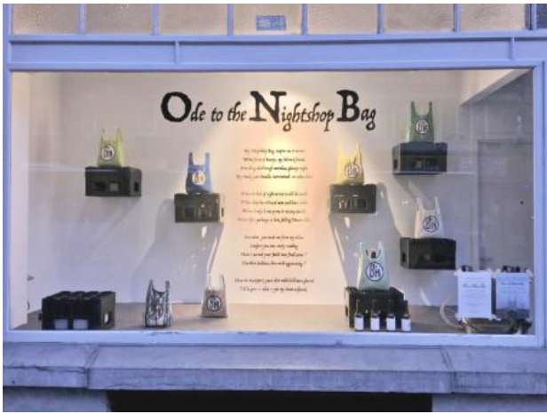
Ode to the Nightshop Bag, 2022 Mixed media, Various dims