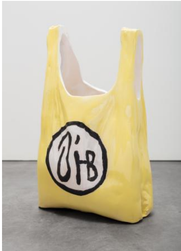
Nightshop Bag, 2022 Keramiek, ± 37 x 23 x 18 cm