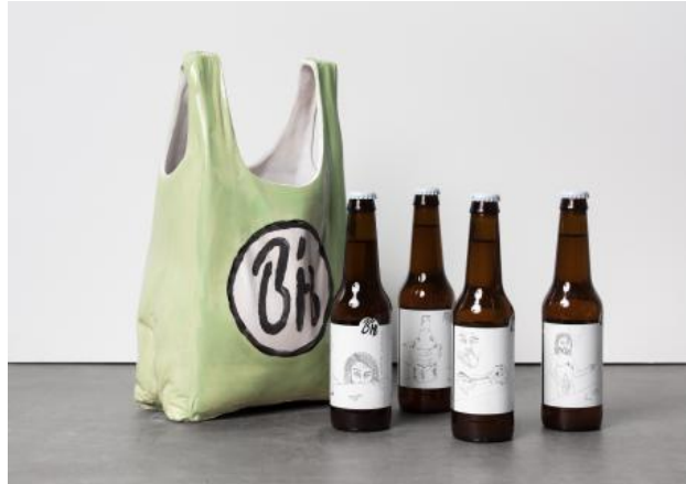
Biro's Home Brewed Bitter, 2022 Keramiek, bier, ± 37 x 23 x 18 cm