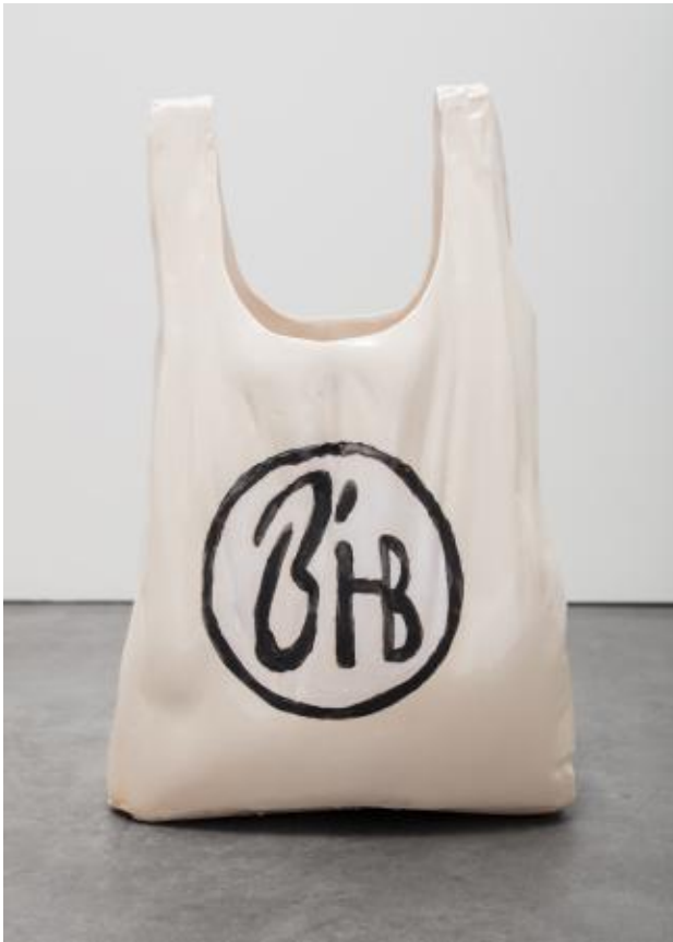
Nightshop Bag, 2022 Keramiek, ± 37 x 23 x 18 cm