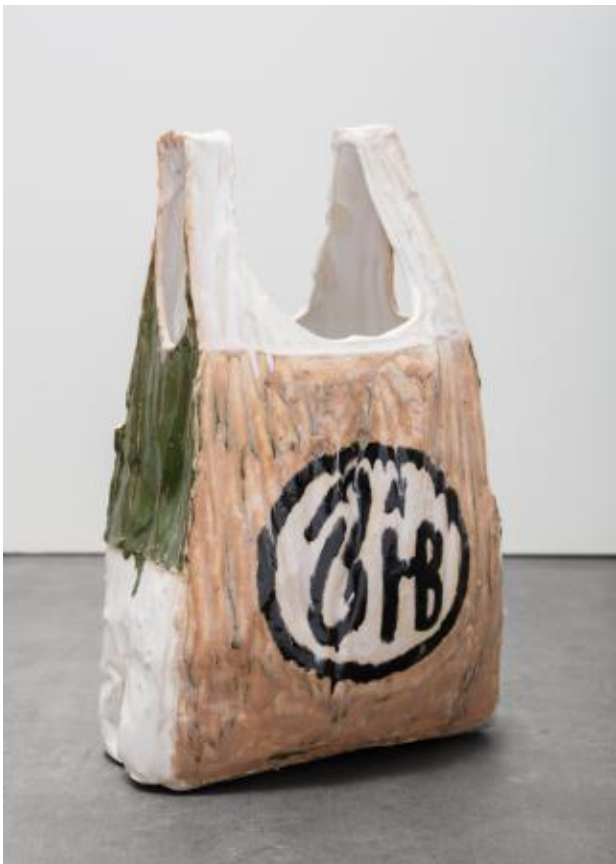
Nightshop Bag, 2022 Keramiek, ± 37 x 23 x 18 cm