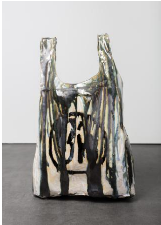
Nightshop Bag, 2022 Keramiek, ± 37 x 23 x 18 cm