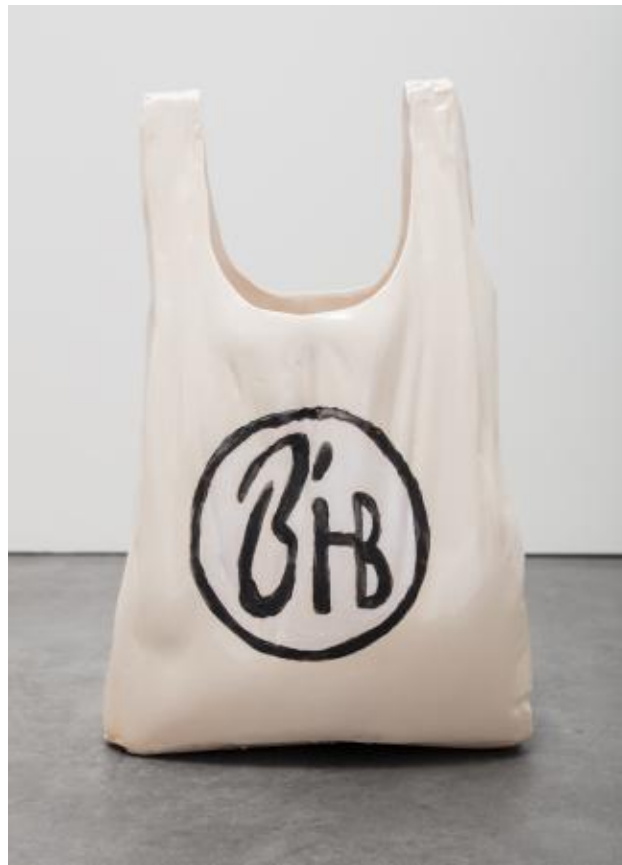
Nightshop Bag, 2022 Keramiek, ± 37 x 23 x 18 cm