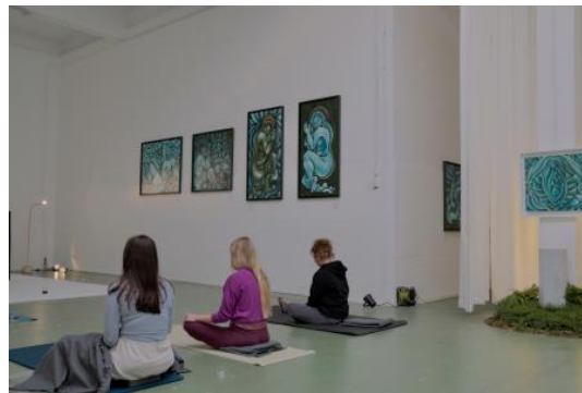
Mindfulness programma voor bezoekers, tijdens expositie, 2024