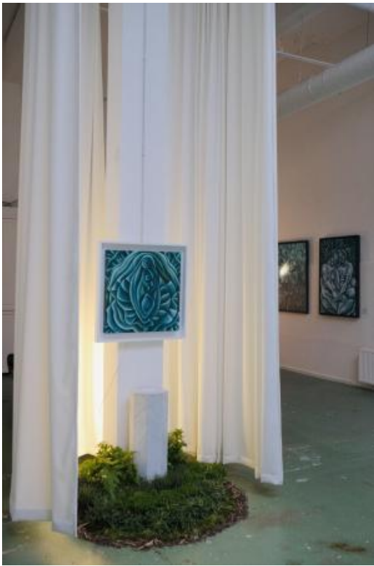
'Flood' - Installation, 2024 Acryl op canvasdoek, mos, varens, lokale kruiden zoals tijm, vernsippert hout en aarde. , Schilderij: 60x60x5cm / Installatie: Diameter van 120cm en hoogte van 600cm