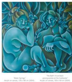
Twee werken: 'Water Springs' en 'The Bath', 2024 Acrylc op canvas, 160x120x4cm // 140x70x4cm / 140x70x4cm

Ongoing project: The "Mother Trees" series explores the concept of mother trees and their impact on human perception of the natural world and our ability to connect with it.