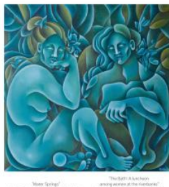
Twee werken: 'Water Springs' en 'The Bath', 2024 Acrylc op canvas, 160x120x4cm // 140x70x4cm / 140x70x4cm

Ongoing project: The "Mother Trees" series explores the concept of mother trees and their impact on human perception of the natural world and our ability to connect with it.