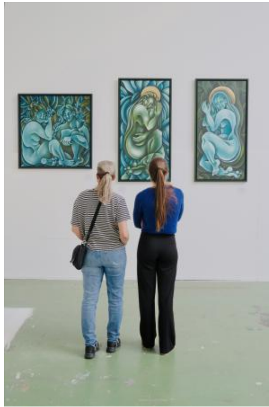
Bezoekers observeren drie schilderijen" 'The Bath', 'Meandering River' en 'Sleeping River', 2024 Acryl op canvas, 100x100x4cm / 140x70x4cm / 140x70x4cm