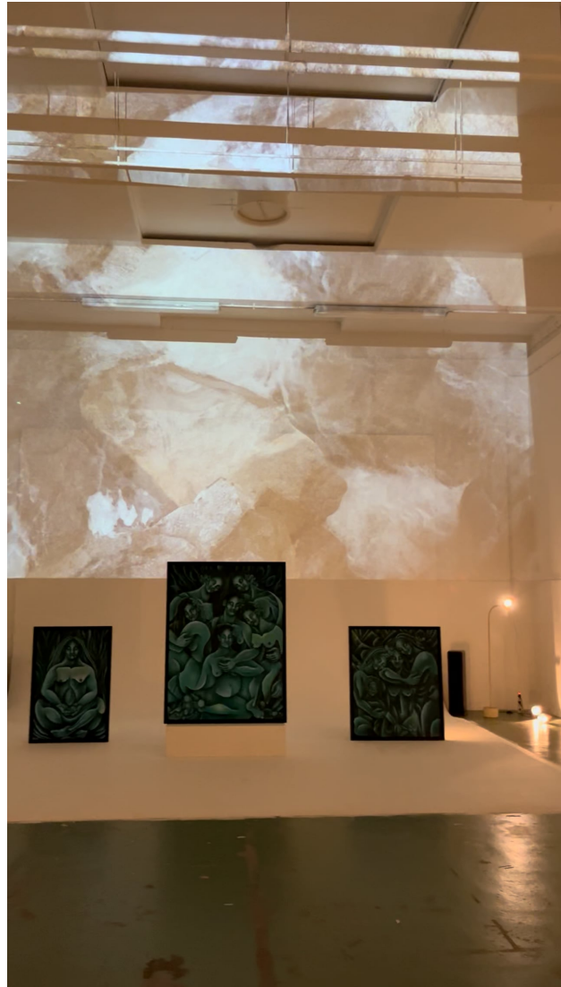
Impressie van de 'Body Currents' expositie, 2024 30 seconden