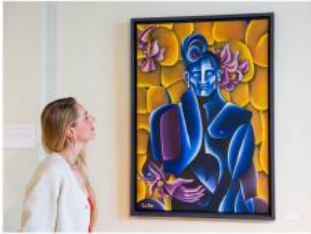
The recent exhibition 'Root to Rise' at the Westergaard in Amsterdam, from 9-28 June 2024. This gallery show celebrated the quality of masculinity and femininity, as we celebrated the vibrant time of European Summer Solstice (or "Miksumma") at the end of the month.