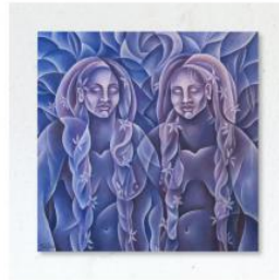
'Skin - scars from resilient women' Acrylic on canvas 90x90cm (square). Available for sale.