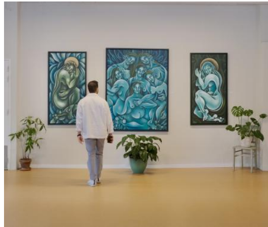
Expositie 'Root to Rise' in Amsterdam, 2024

"Skin - scars from resilient women", 2024 Acryl op canvas, 90x90x4cm