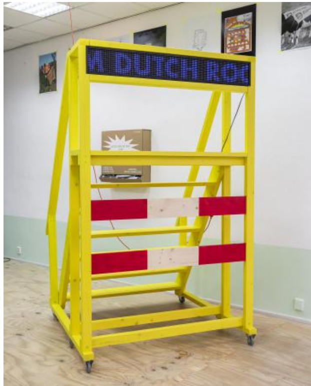
ongetiteld, 2023 gemengde media, aprox 150x130x210cm