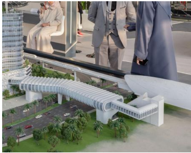
ongetiteld, 2023 Fotografie