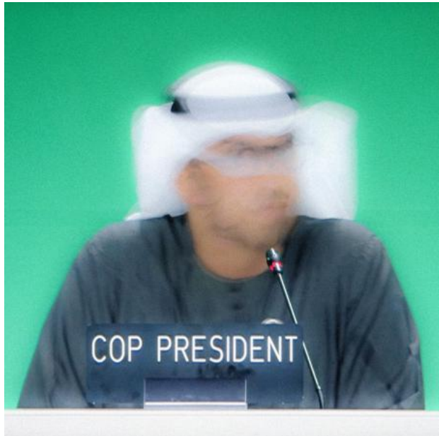
ongetiteld, 2023 Photography