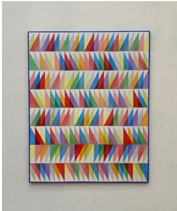
Triangle Sequence Nr.2, 2024 Olieverf, 120x150cm