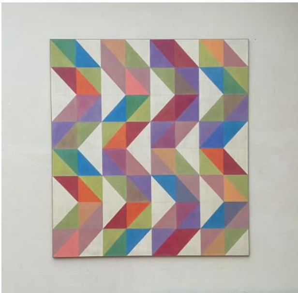
Rectangular dance.1, 2024 Olieverf, 200x220cm