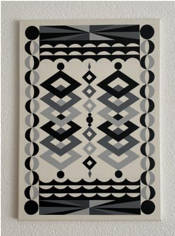
Energy template.1, 2021 acrylverf, 50x60cm