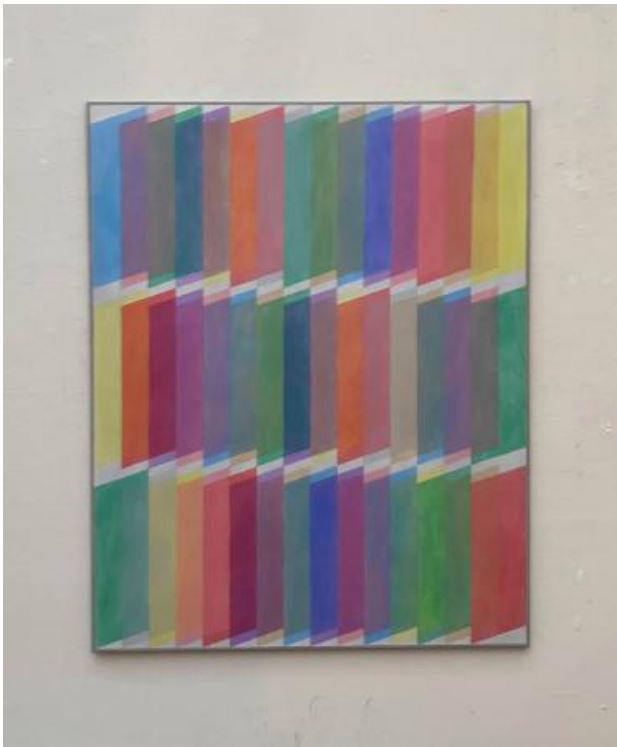
Panels, 2024 Oil paint, 120x150cm