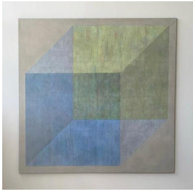
Cube. Nr.2, 2024 Potlood en olieverf, 180x180cm