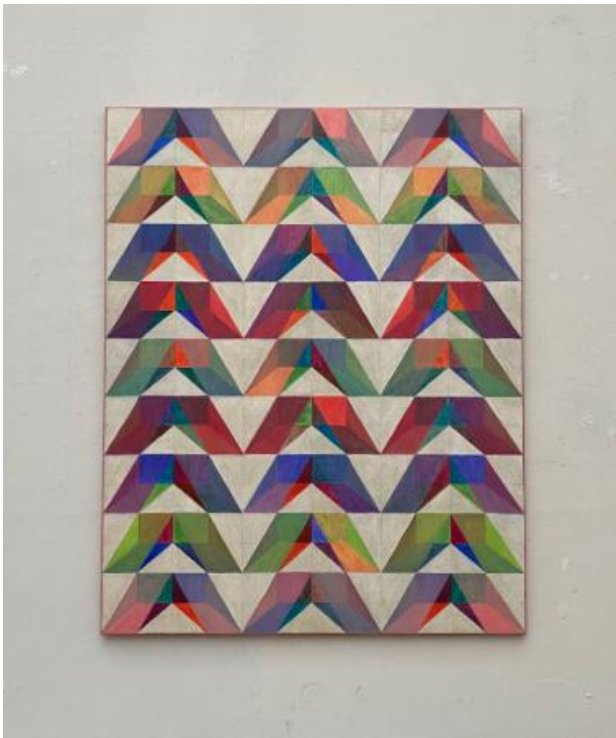
Rithm of 3D Triangles, 2024 Potlood en Olieverf, 120x150cm