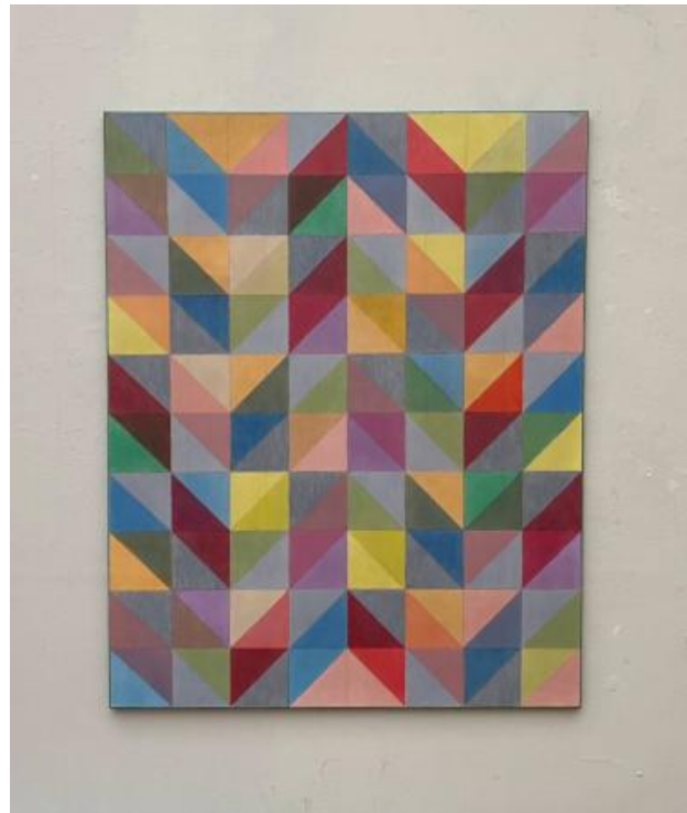
Rectangular Rithm., 2024 Olieverf, 120x150cm