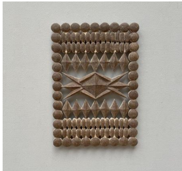
Energy Talisman., 2023 Hout, 50x60cm