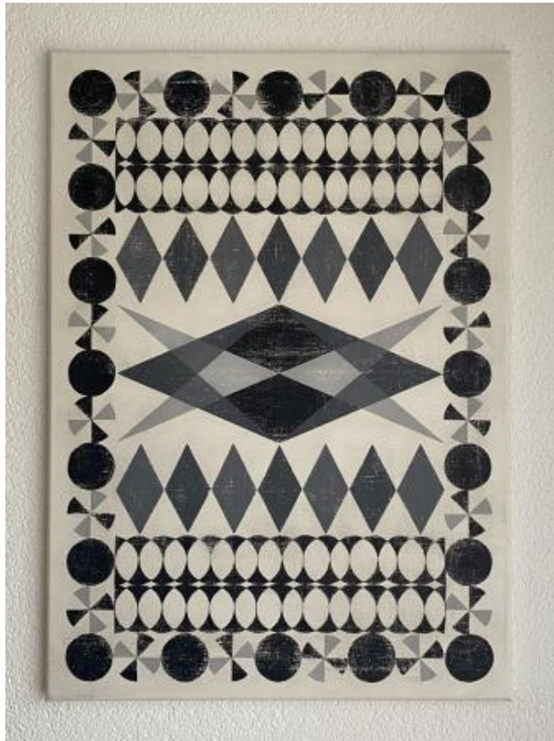
Energy template. 2, 2021 acrylverf, 50x60cm