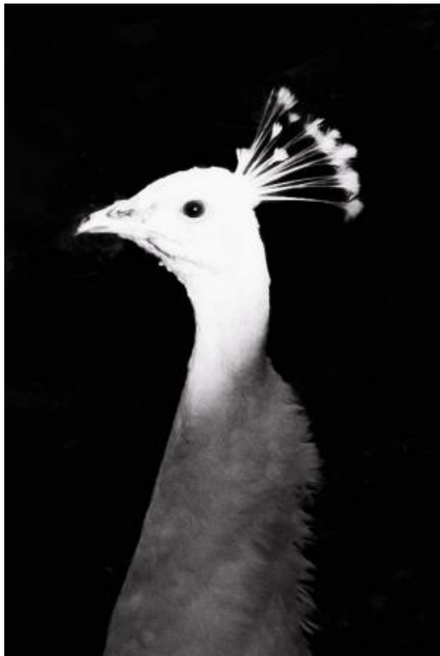
De Wijnrode Zee, 2022