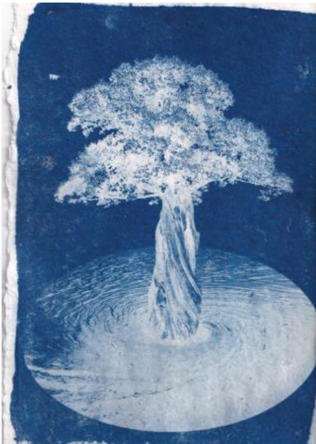
voel je vrij om met planten te praten, 2024 cyanotypie