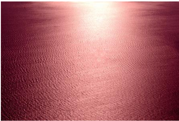
De Wijnrode Zee, 2022