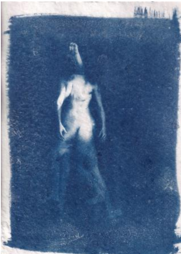
voel je vrij om met planten te praten, 2024 cyanotypie