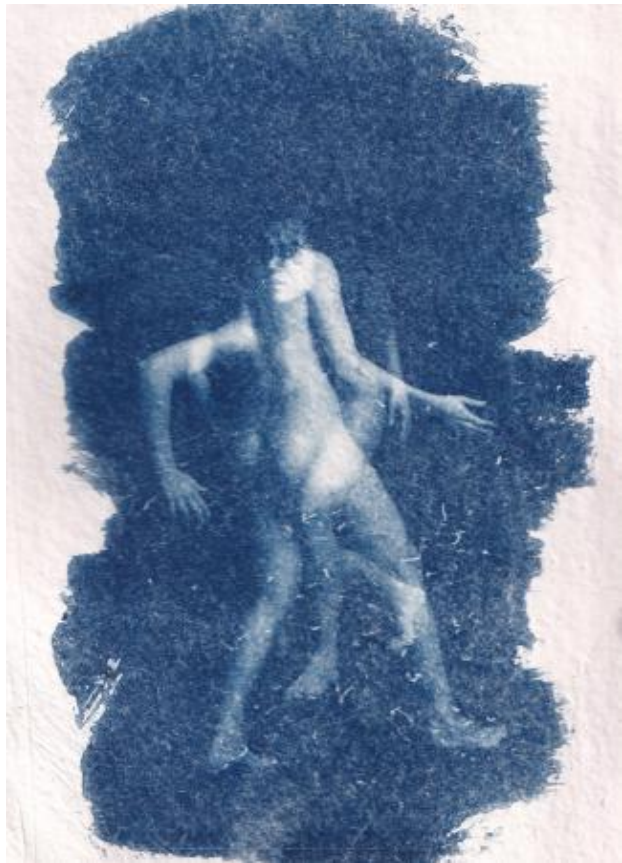
voel je vrij om met planten te praten, 2024 cyanotypie