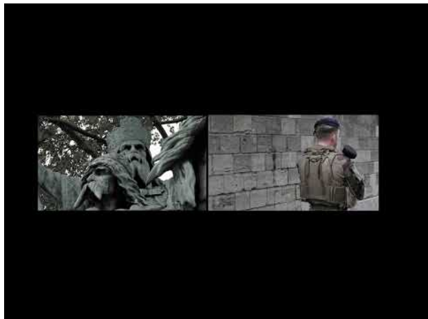
Stemmen uit het verleden, 2023 4:57