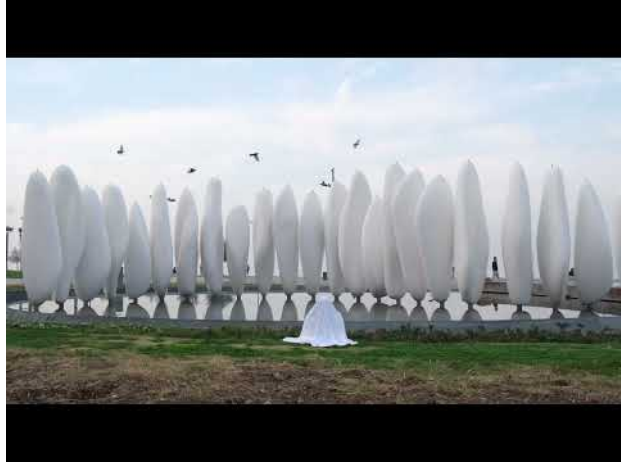
De enige constante in het leven is verandering, 2022 03:13