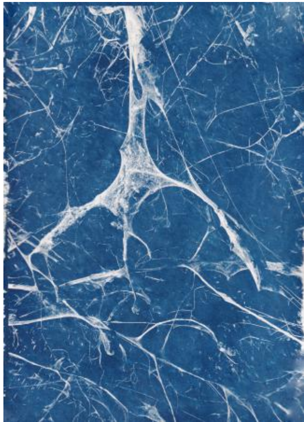
voel je vrij om met planten te praten, 2024 cyanotypie