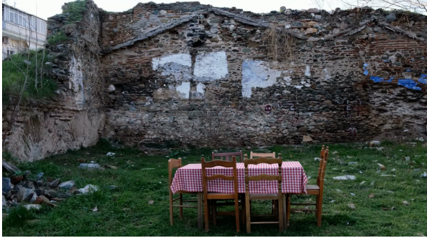
De terugkeer is slechts een verre droom, 2024 04:09