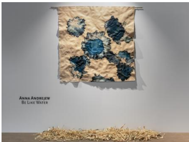
Be Like Water, 2024 Maisbladeren papier, cyanotype, performance, 130x130 cm