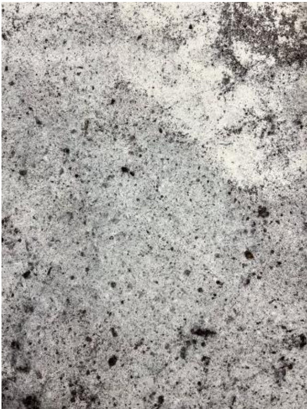
Zij raakte me (aan), 2024 handgeschept papier, aarde, 40x40 cm