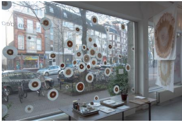
Terra Incognita, 2023 Chromatographs van bodem and mijn lichaam, workshops