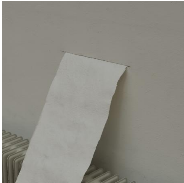
THE CLOUD IS A PLACE ON EARTH, 2024 Installatie, participatieve performance, publicatie