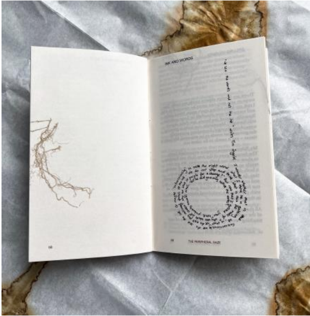
The first impression on your skin, 2024