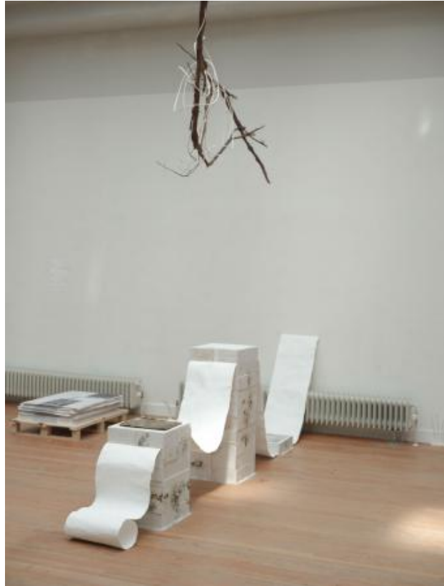
THE CLOUD IS A PLACE ON EARTH, 2024 Installatie, participatieve performance, publicatie