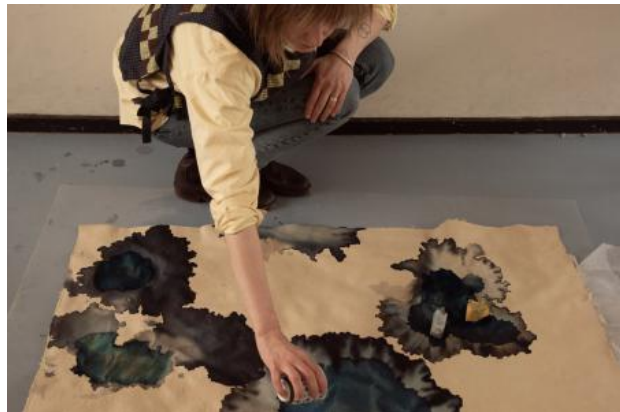
Be Like Water, 2024 Maisbladeren papier, cyanotype, performance, 130x130 cm