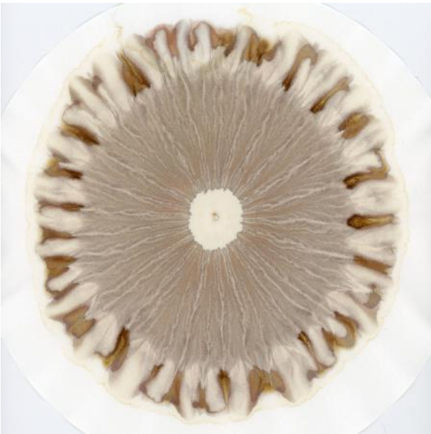
Terra Incognita, 2023 Chromatographs van bodem and mijn lichaam, workshops