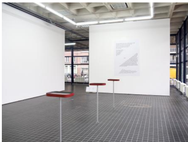
Scores on a cold ground 1,2,3 , 2024 Metaal, aluminium, imitatieleer, plexiglas, stickers, hout, 3 x 1,0mx40cmx30xm