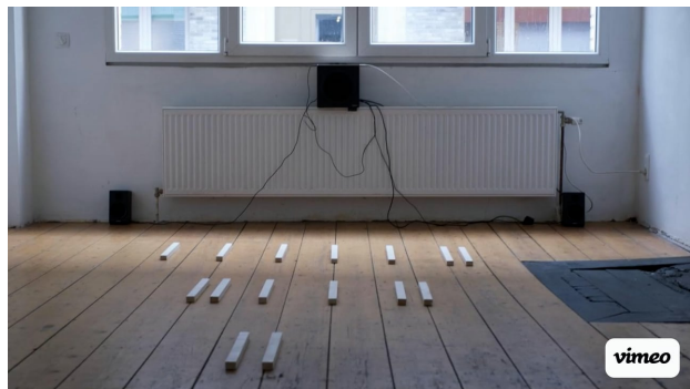
Hear----from----you---soon----, 2023 00:17