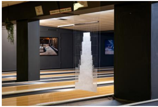
A Beaten Path, 2024 Hand engraved plexiglass