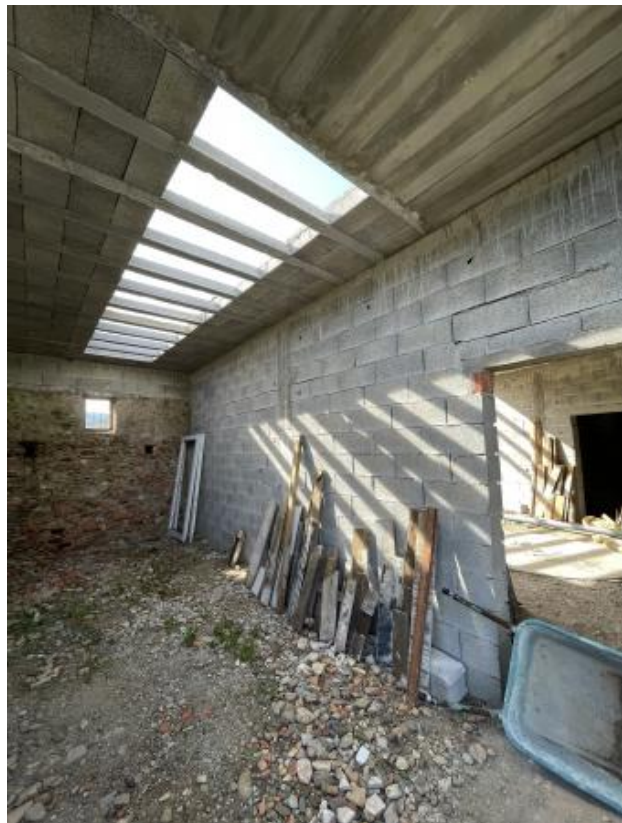
7 Halos , 2023 30 / 5 000 tijdsgebonden lichtinstallatie, Dimensions variable