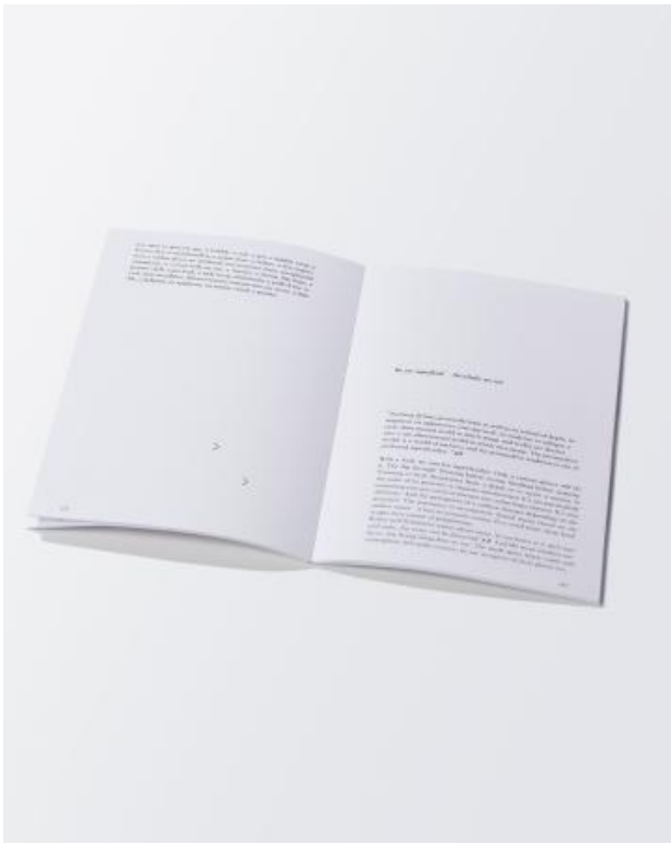
Watervleugels; Topofilie naar de oppervlakte, 2024 laserprint op papier, a5