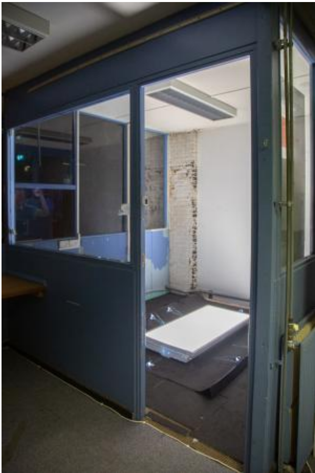
Polaris, 2023 LED-verlichting, TL-licht, Autotapijt, UV-beschermfolie, Aluminium, staal, Handgesneden glas, Dimensions variable