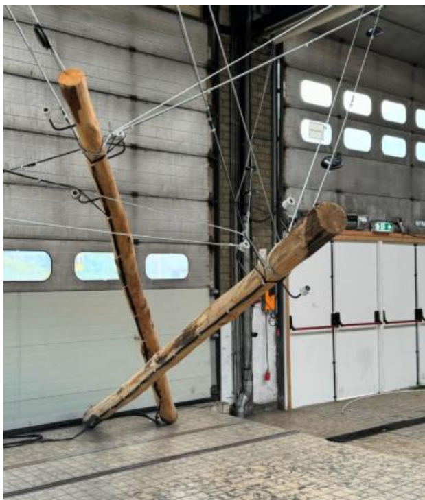
50Hz Conference Call , 2024 12-kanaals audio-installatie. elektriciteitsmasten, isolatoren, staaldraden, conferentieluidsprekers, mp3-spelers, staal, aluminium., 4m x 6m