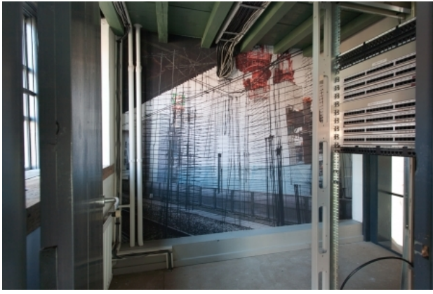
Menshin, 2015 installatie, muurvullend