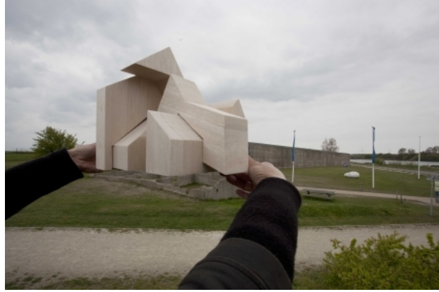
Caisson II, 2017 balsahout, 45 x 68 x 37 cm