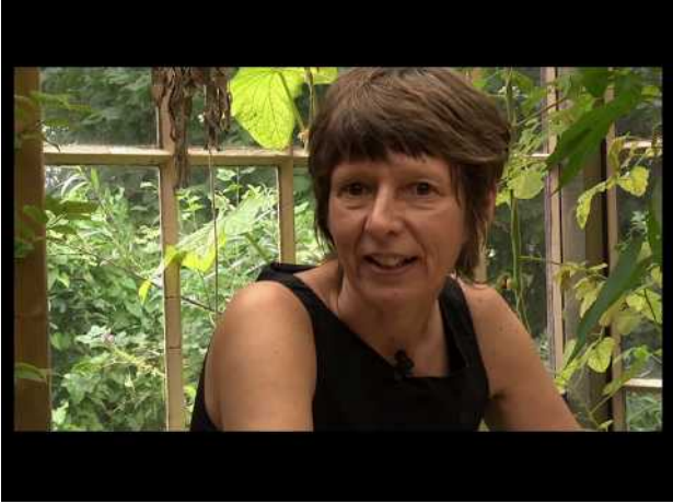
nederzetting, door zand geschuurd, 2019 8 minuten