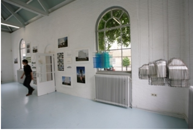
caisson, bouwwerken geen gebouw zijnde, 2017 maquettes, tekeningen en fotocollage's