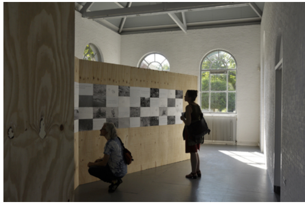
nederzetting, door zand geschuurd, 2018 ruimtelijke structuur (deel van de fundering van de kapel van Onze Lieve Vrouwe op Zee) waarop tekeningen, foto's, teksten en een film getoond werden, ruimtevullend