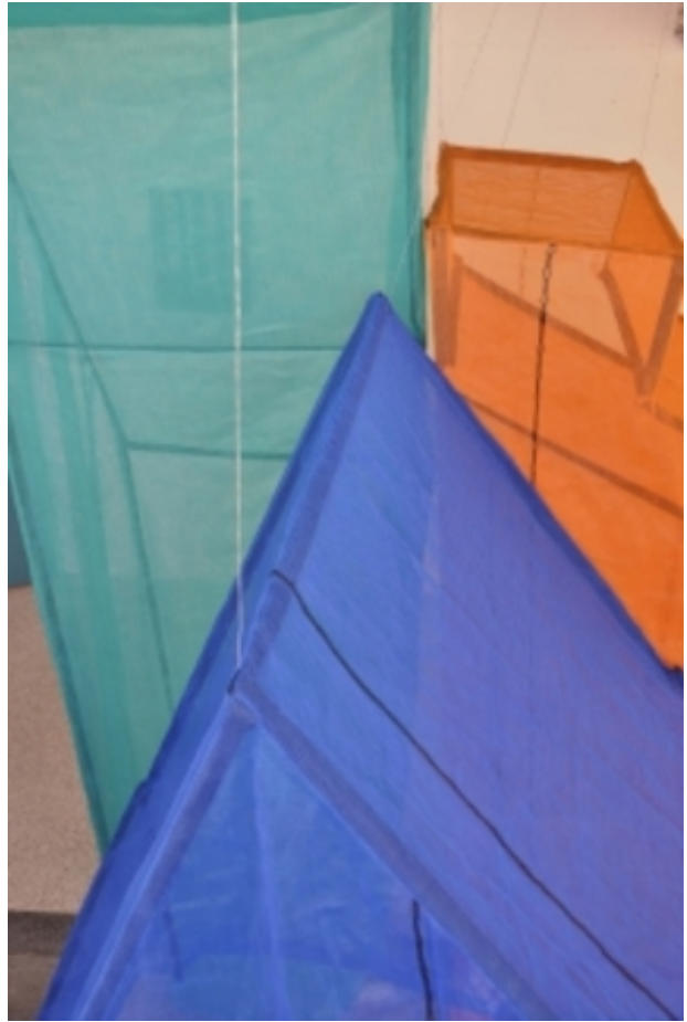
onder constructie, 2016 steigergaas, buizen, staaldraad