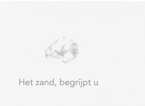
nederzetting, door zand geschuurd, 2018 tekening, 19 x 29 cm