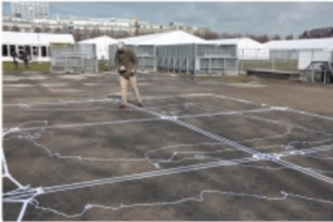
'Als een netwerk van omwegen', 2016 keperband, textielband, figurant, 7 x 11,5 m