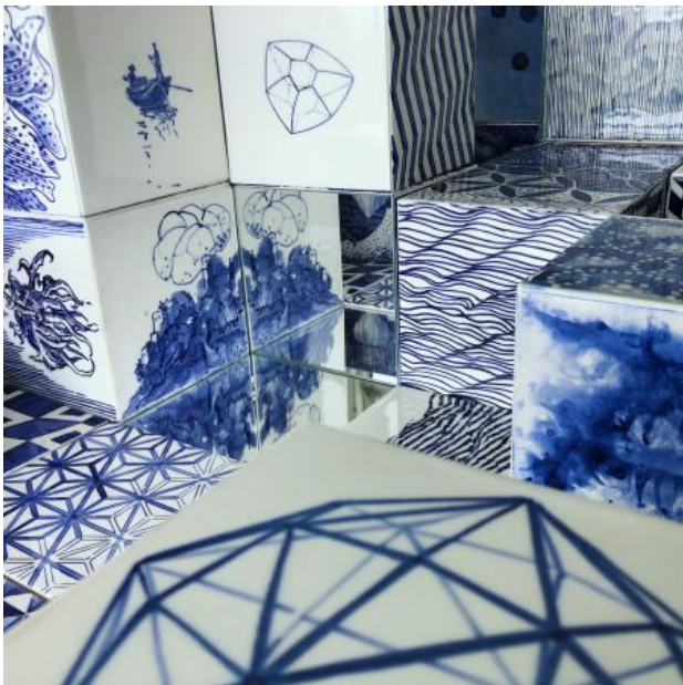
intotheblue, 2024 onderglazuurtekeningen op keramiek, glas, variabel, vanaf 15 x 15 x 15 cm

2011 - organisatie open atelierroute den Haag 2016