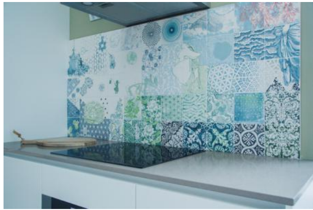
scarfdancing, 2021 onderglazuurtekening op keramiek, 165 x 75 cm