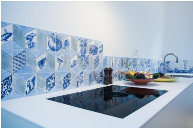
leporello, 2021 onderglazuurtekening op keramiek, 45/30 x 400 cm