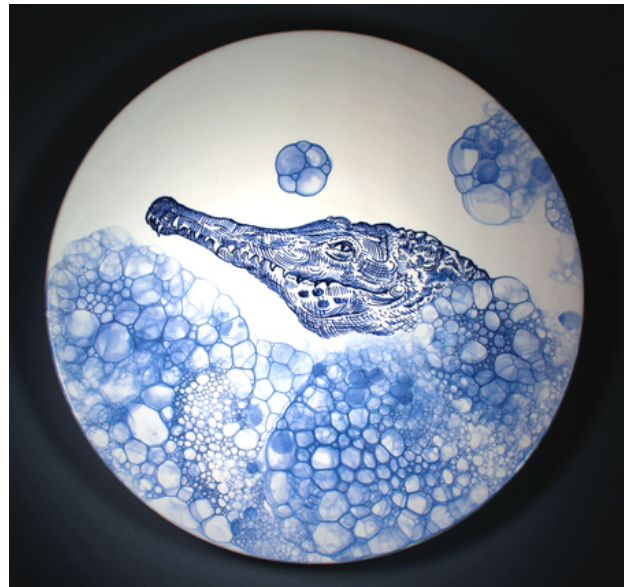
Princess Crocodile, 2019 onderglazuurtekening, d.42 cm