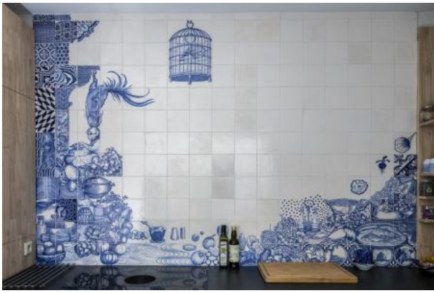
bacchus, 2022 onderglazuurtekening op tegels/ keramiek, 170 x 255 cm