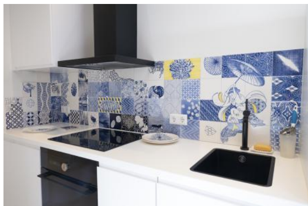
jump, 2023 onderglazuurtekening op tegels/ keramiek, 60 x 300 cm