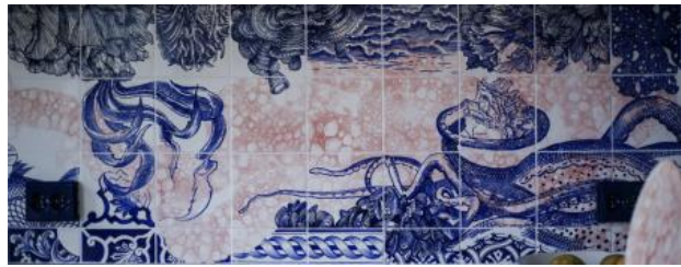
octopusses garden, 2021 onderglazuurtekening op keramiek, 495 x 55 cm