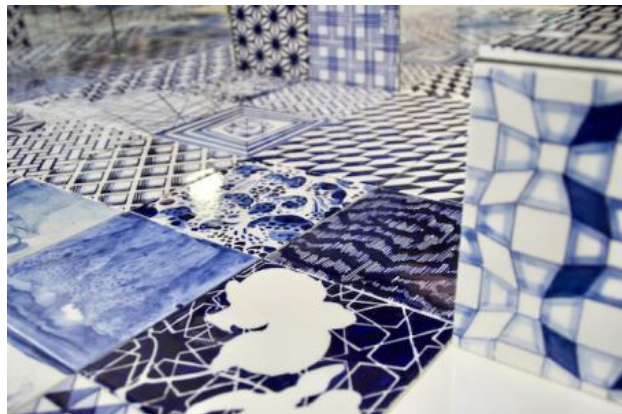
intotheblue, 2023 onderglazuurtekeningen op keramiek, glas, variabel