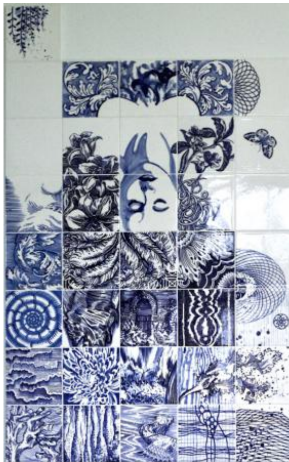
, 2020 onderglazuurtekening op keramiek, 75 x 120 cm