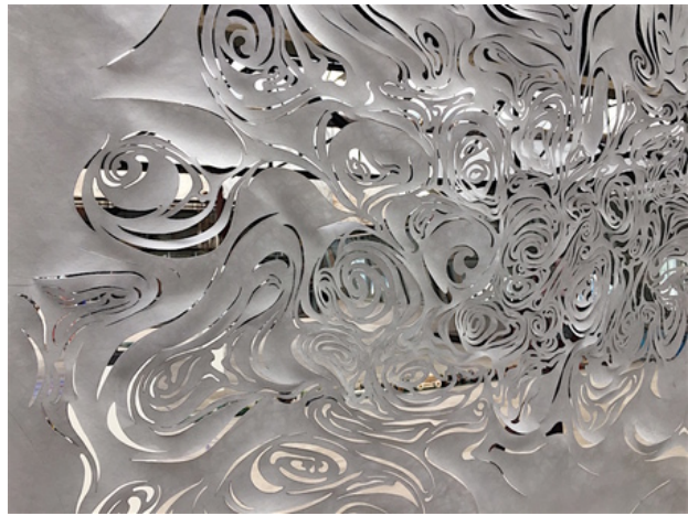
Schouwerzijl, détail, 2017 Gesneden tyvek, 153x90 cm