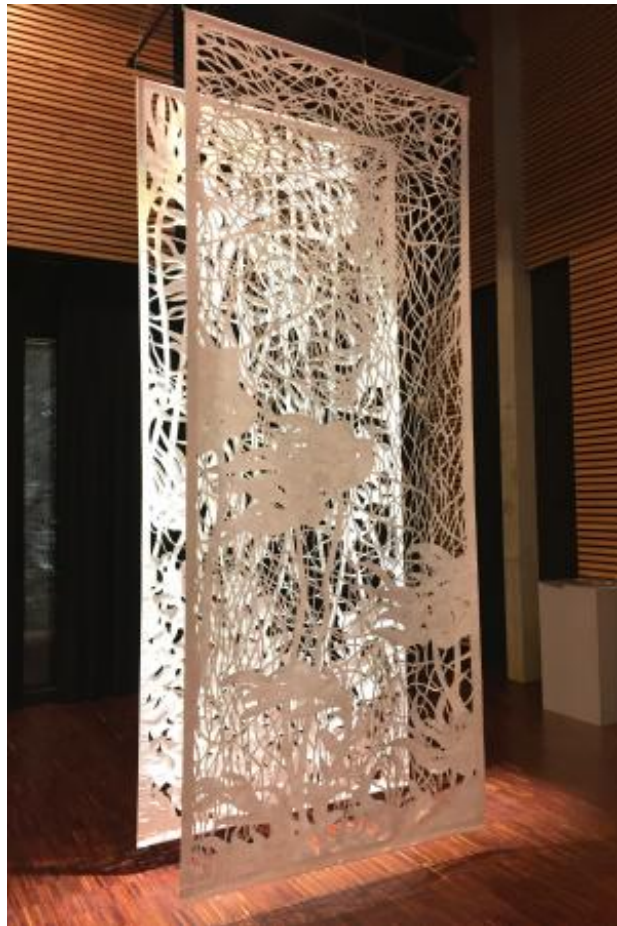
Zeewierwoud, 2020 Gesneden Tyvek, 60x143x334