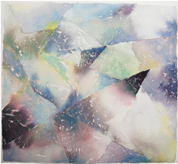
Galaxy, 2019 aquarel, 30x40