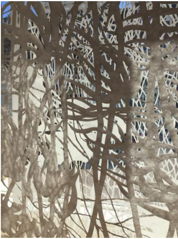
Zeewierwoud -detail, 2020 Gesneden Tyvek, 60x143x334