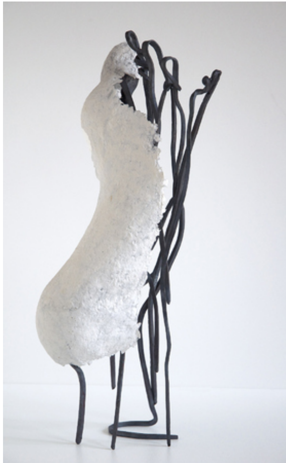
Wit voetje, 2015 gesmeed cortenstaal en papier, 25x15x15 cm