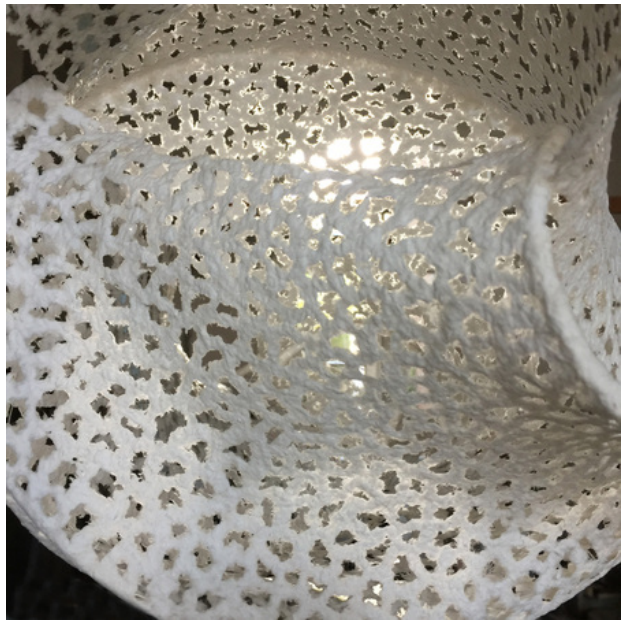
Lichtnet, 2016 papier maché