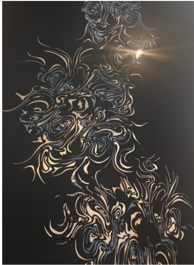
Berlin -detail, 2016