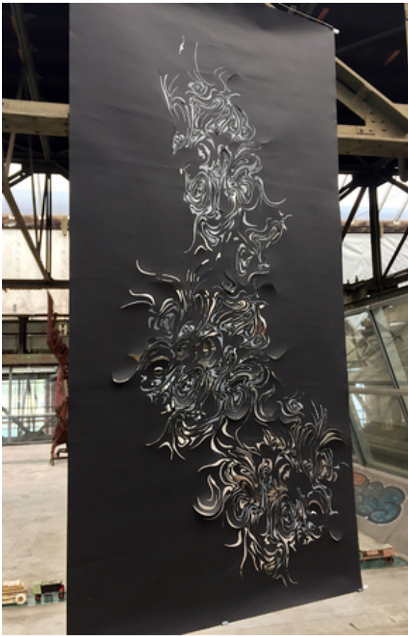
Berlin, 2016 potlood en gesneden papier, 100x210 cm