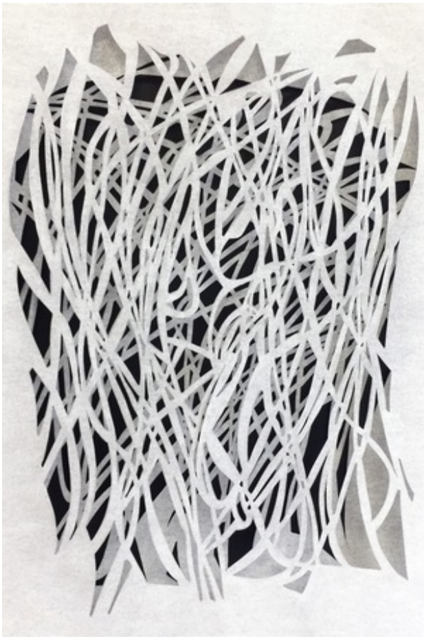
Liggend in het gras, 2017 gesneden pergamon, 25x3x35