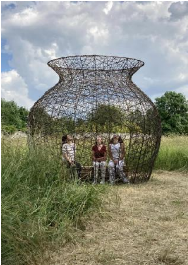
L'Observatoire, 2023 Beukentakken op metalen frame, 350 x 300 x 350 cm