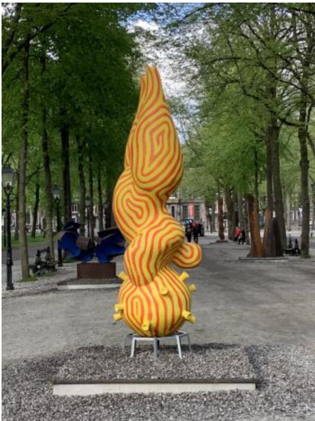
Challenge for Balance, 2021 Acrylaat, 300 cm hoog