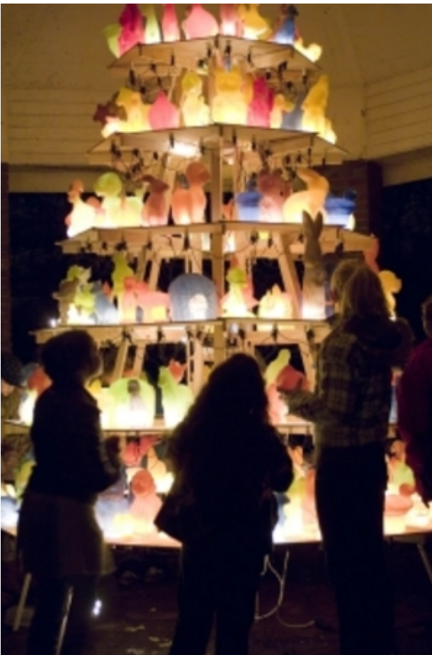
Klein dieren festijn, 2008 hout, paraffine, 350 hoog