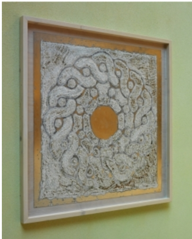
Zonnetuin, 2007 zout op ijzer, 100 x 100