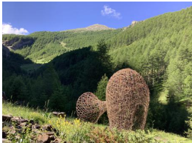
TADITADATADI - Akunzo, 2020 hazelaar, 300 x 150 x 300 cm