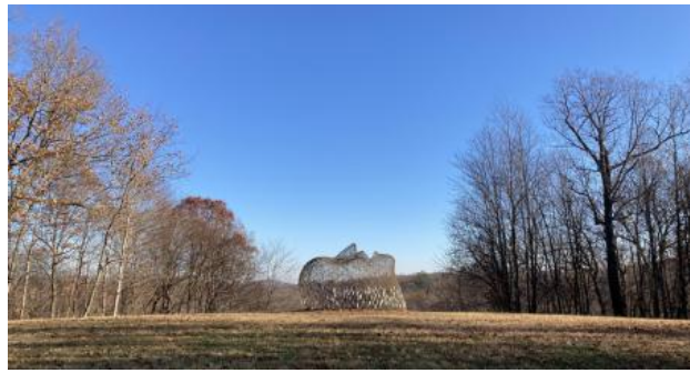
Oxygen, 2022 Beukentakken op metalen frame, 500 x 250 x 350 cm