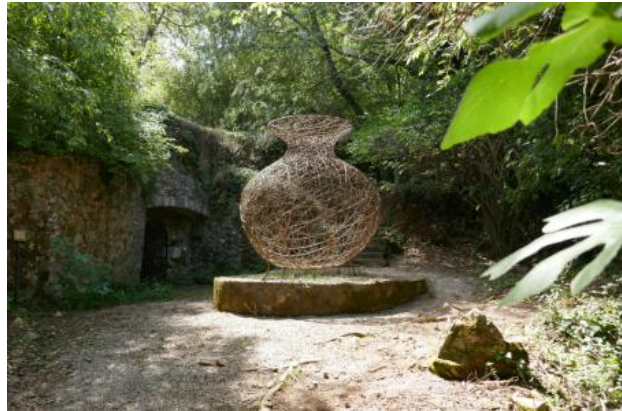
RESERVOIR - Akunzo, 2021 hazelaar, 220 x 220 x 280 cm