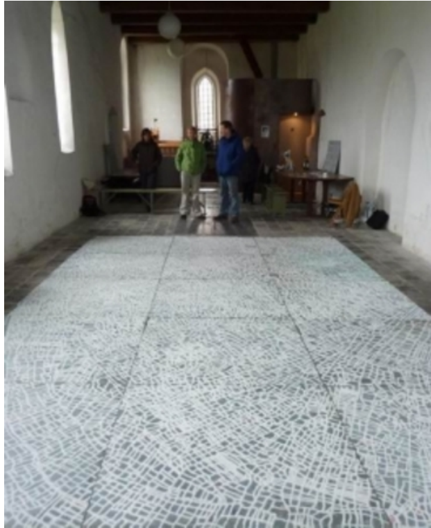
Friese Landschap, 2012 zout op ijzer, 600x450