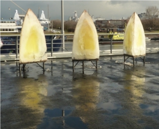
Gothische Vormen, 2015 IJs, 200 x 100 x 100